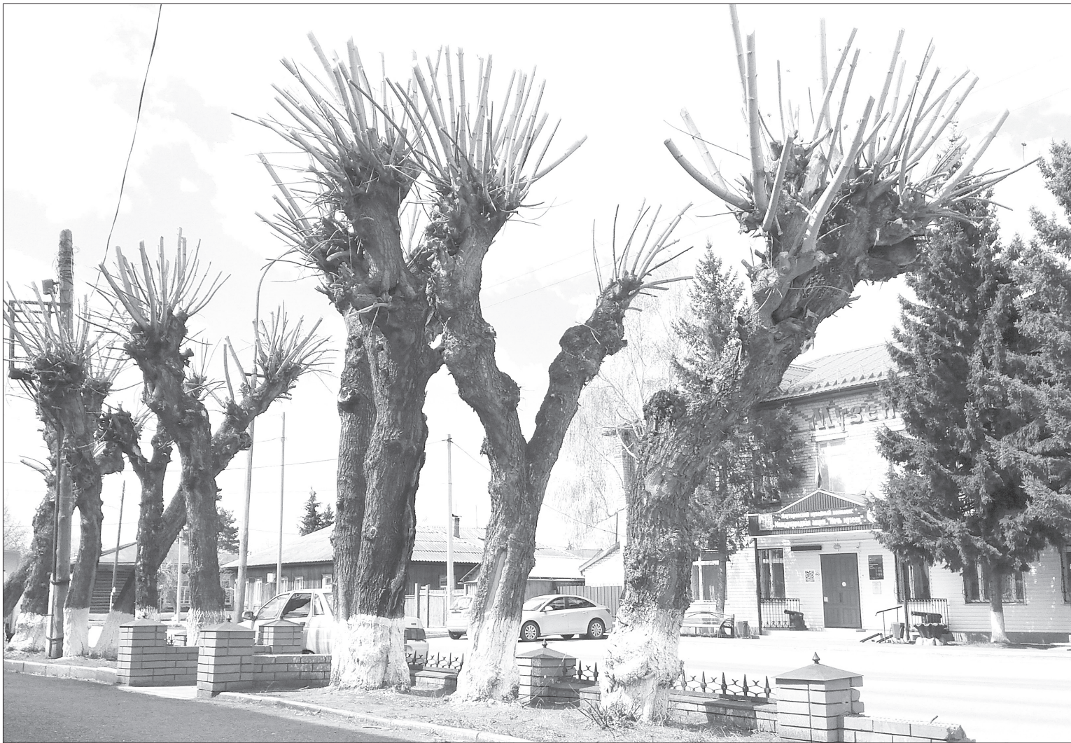
Тополя на Революции напомнили горожанам крымские пальмы

Как сообщили в администрации города, в зону деятельности ООО «Спецбиосервис» попали скверы - у фонтана, имени Кауля, 350-летия Ялуторовска, имени Якова Копя, Железнодорожный, Депутатский, Ветеранов лесозавода, Рабочий. Потравили опасных насекомых на Зеленом бульваре, на территориях возле «второй» и «четвертой» школ, вдоль тротуара на улице Бахтиярова - от «Зеленой рощи» до улицы Русакова, и от детского сада №3 до дома 181 по Революции. Работаны Мемориально-духовный комплекс, участки на пересечении Красноармейской-Тобольской и Сирина-Советской, вдоль железнодорожной ветки.