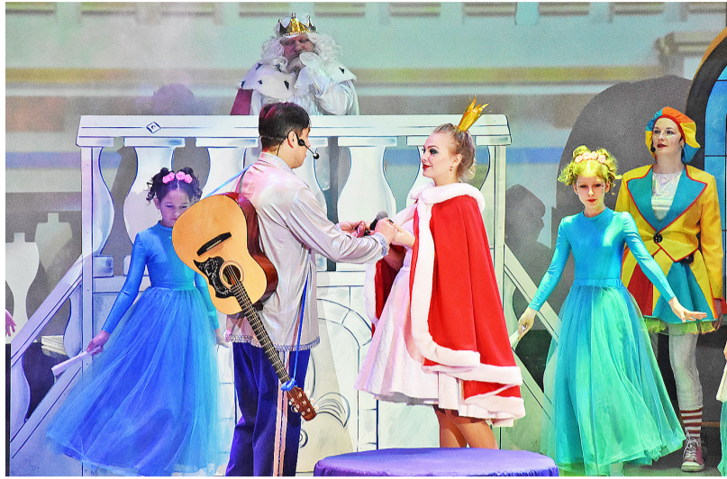
Шикарные костюмы артистов сделали спектакль по-настоящему сказочным

Школьники наблюдали за тем, что происходит на сцене, помогали актёрам. Некоторые даже под-