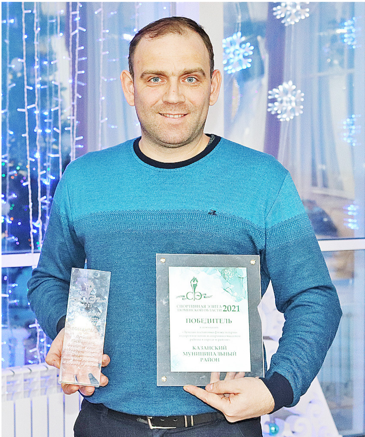
Спортивные регалии будут бесспорно стимулировать спортсменов Казанского района на дальнейшие победы