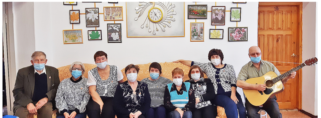
Реабилитанты довольны организацией мероприятий, подготовленных специалистами центра соцобслуживания

Кроме того, для членов группы дневного пребывания проводятся просветительские занятия: «Школа здоровья», «Школа безопасно-