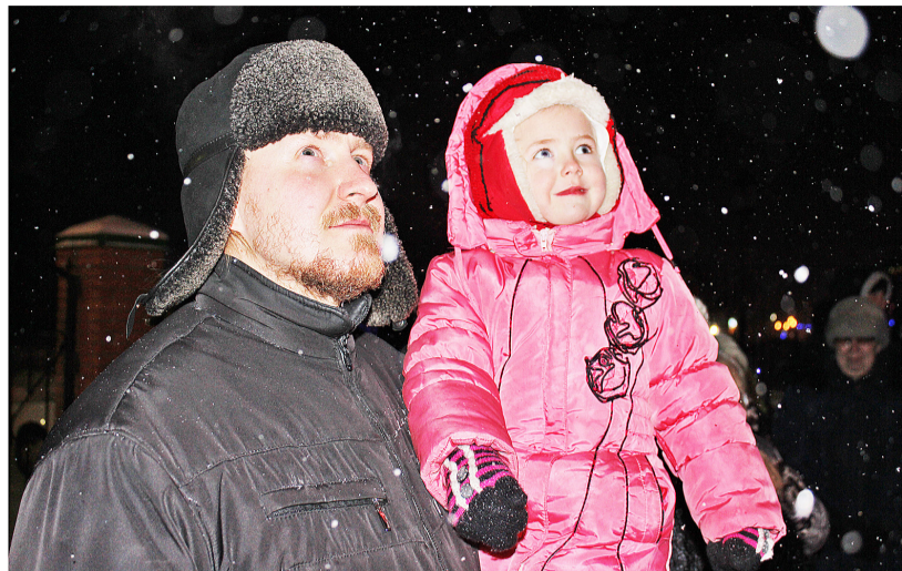
Чистота в глазах ребёнка – отсвет божественной благодати