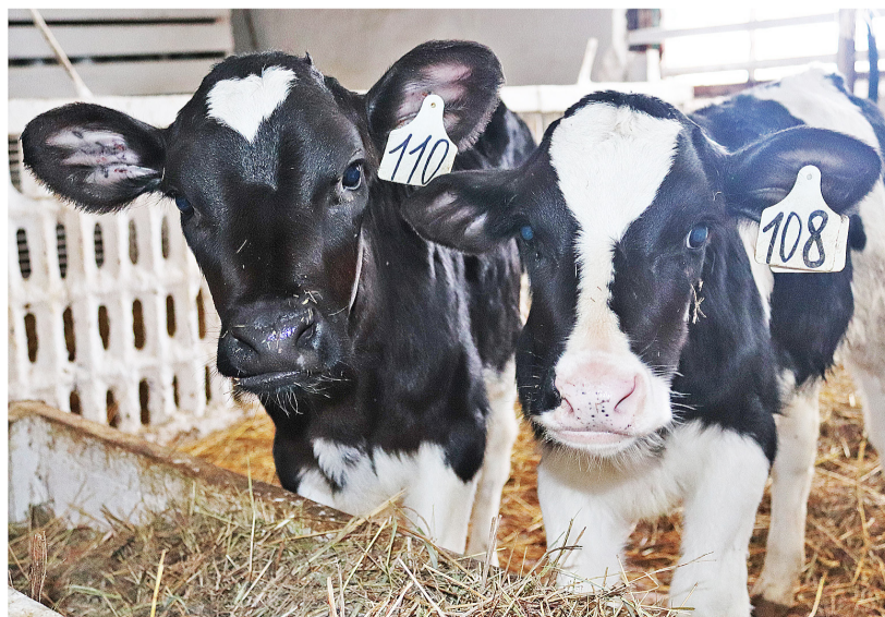
Телята на предприятии сытые, чистые и ухоженные

По данным районного управления по развитию АПК, на 1 декабря 2021 года поголовье коров в хозяйствах всех форм собственности составило 3052, в 2020 году их было 2965. Надой на фуражную корову за 11 месяцев текущего года – 6412 килограммов молока, годом ранее этот показатель равнялся 6409. Производство молока за аналогичный период 2021 года выросло на 90 тонн и составило 19557 тонн. Правительством Тюменской области в связи с неблагоприятными погодными условиями животноводов была оказана поддержка в виде субсидий на приобретение кормов. В Казанском районе с учётом всего поголовья крупного рогатого скота размер дотаций составил 34 410 тысяч рублей.