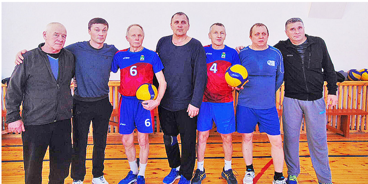
Даже самым именитым командам приходится считаться с ветеранами спорта