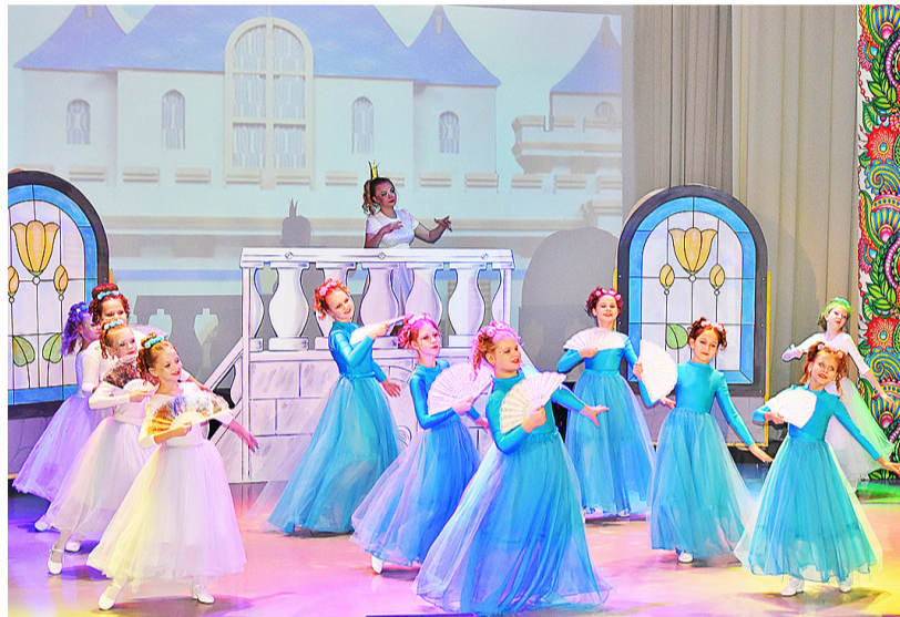
В постановке было много массовых сцен, песен и ярких танцевальных номеров