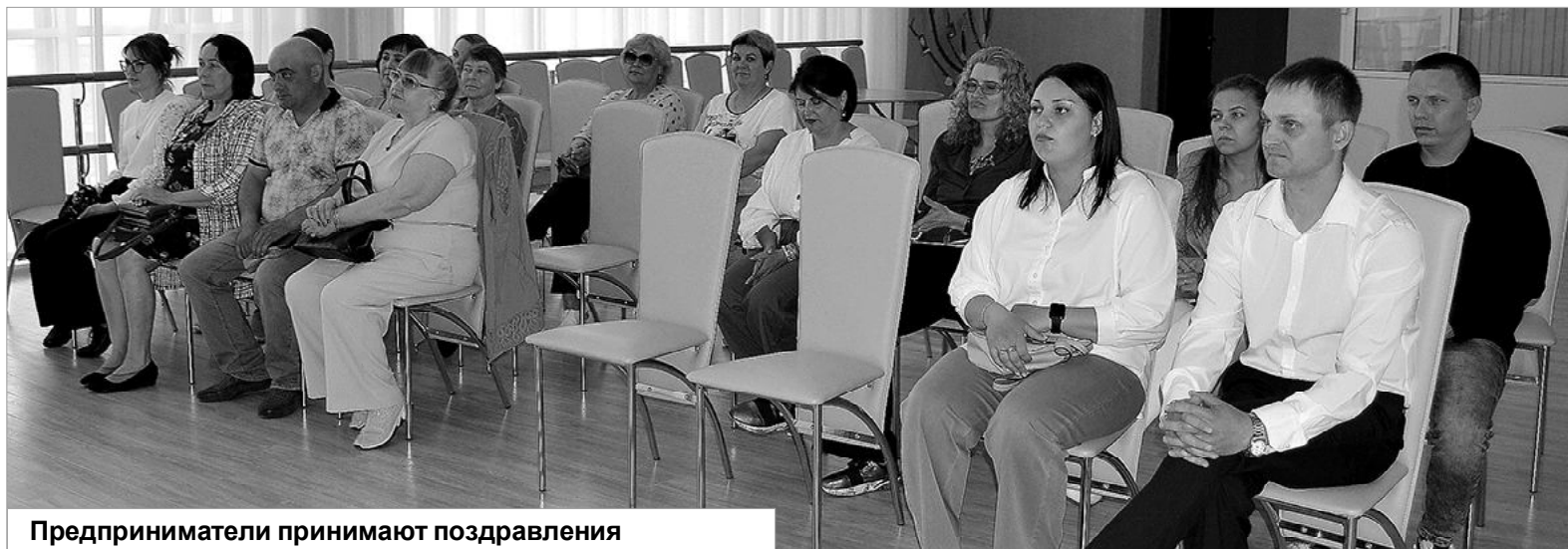
Предприниматели принимают поздравления