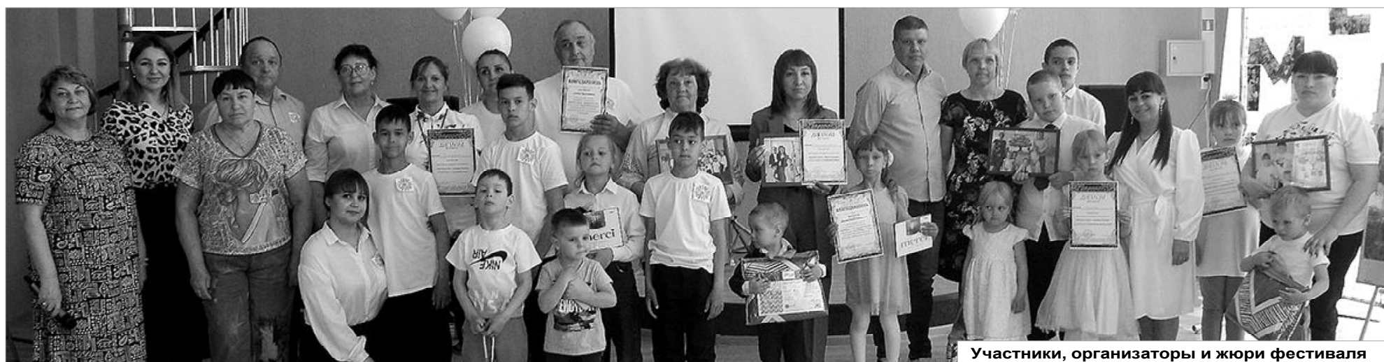
Участники, организаторы и жюри фестиваля