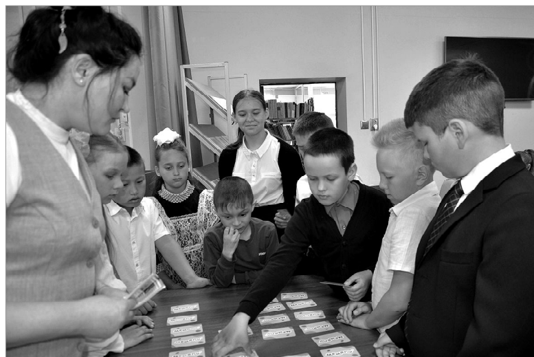
Знакомство с историей региона через игру

После интересной беседы ребята проверили полученные знания в тематической викторине. И надо сказать, довольно успешно ответили на вопросы. Затем девочкам и мальчишкам было предложено поучаствовать в краеведческой игре, рассказывающей о тюменском крае. На столе раскладывались карточки, каждый ученик по очереди брал две. Если картинки совпадали, то он их оставлял себе, а ведущий рассказывал о том, кто или что на ней изображено. Например, ишимские бугры — возвышенность на правом берегу реки Ишим в Казанском районе, являющиеся памятником природы регионального значения, или портрет Григория Ефимовича Распутина, уроженца Тобольской губернии, вошедшего в историю по такому известному факту, как дружба с российским императором Николаем II. А если совпадений не было — карточки возвращались на место и ход переходил к