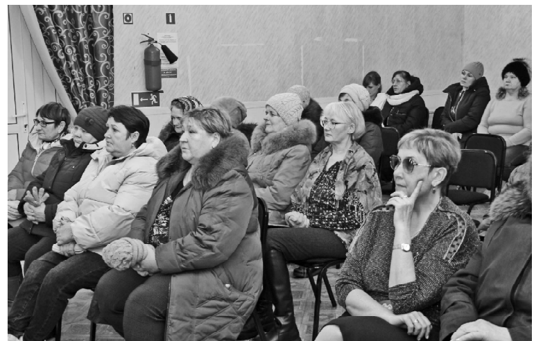
В Поддубровном