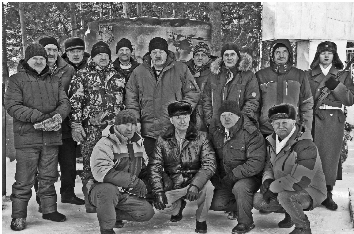
➤ Воины-интернационалисты Викуловского района