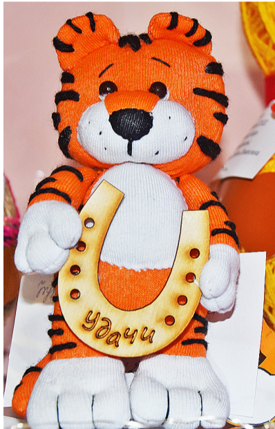
Все поделки выставки получились необычными и яркими

В конкурсе приняли участие дети из Казанской, Пешнёвской, Большеченчерской, Ильинской, Дубынской, Огнёвской школ, воспитанники Копотилковского и Огнёвского детских садов и Казанского центра развития детей. На суд жюри было представлено 154 работы.