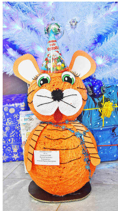
«Весёлый тигрёнок» – так называлось изделие Ксении Ташлановой из Огнёвской школы