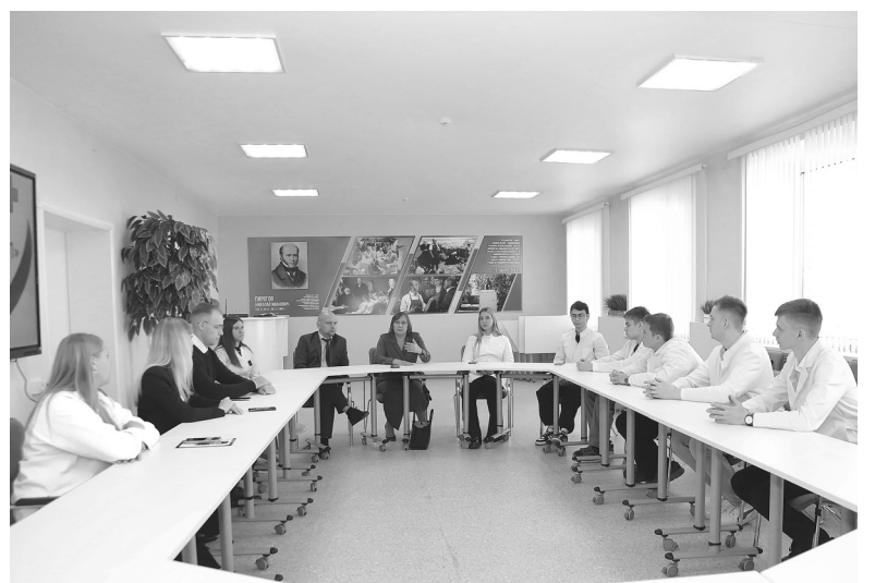
В центре компетенций Областной больницы № 11 студентам Тюменского медицинского университета рассказали о перспективах работы в этом медучреждении

Наталья ГЛАДКОВСКАЯ