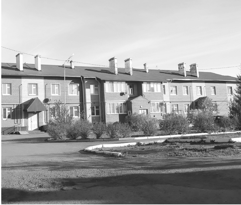
Лучший двор многоквартирного дома – на улице Максима Горького в посёлке Голышманово

В администрации Голышмановского округа подвели итоги ежегодного конкурса по благоустройству. Его организовывали в рамках программы «Основные направления развития жилищно-коммунального хозяйства муниципалитета на 2023-2025 годы».