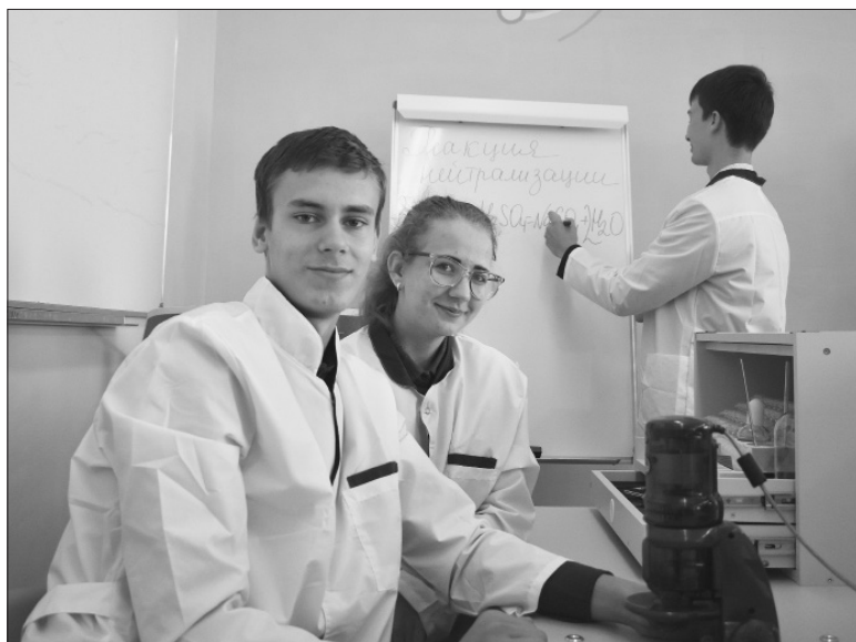
Учащиеся 11 класса тестируют оборудование лаборатории.