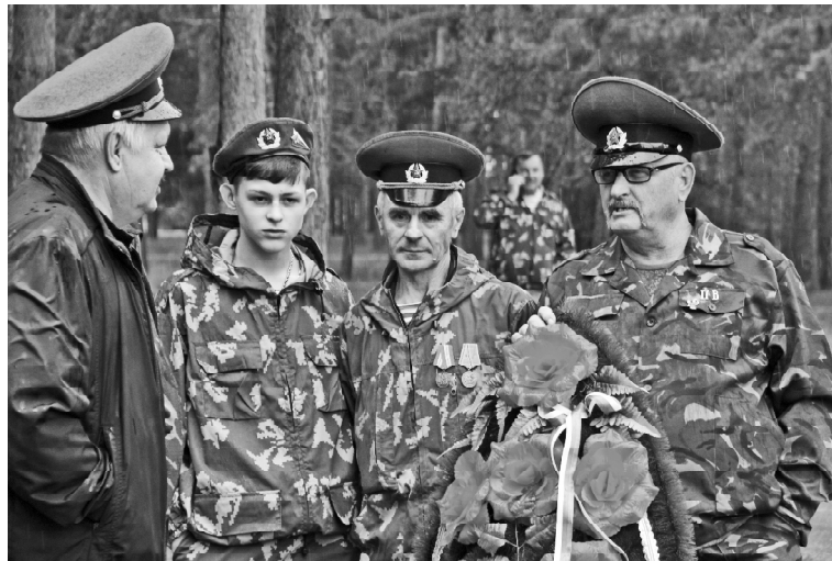
» В День пограничника у Момериала Славы