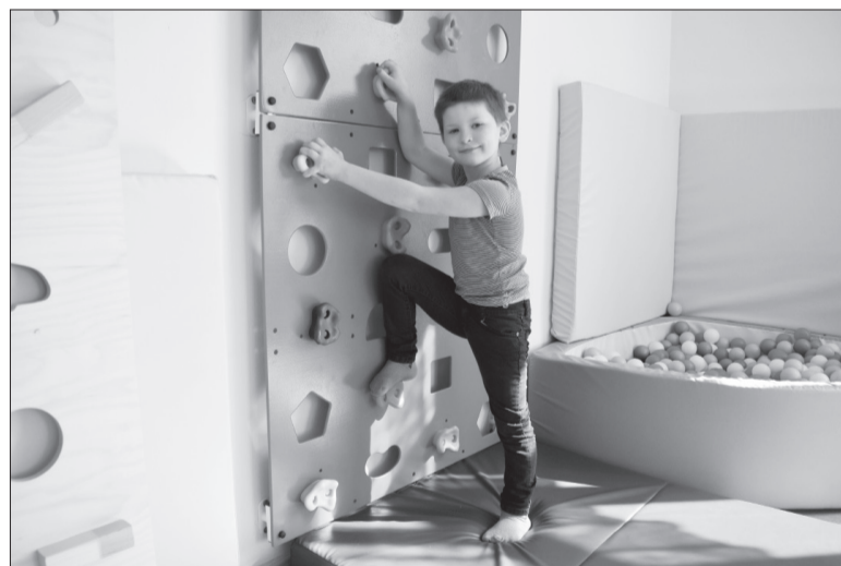
Играть на скалодроме особенно интересно.