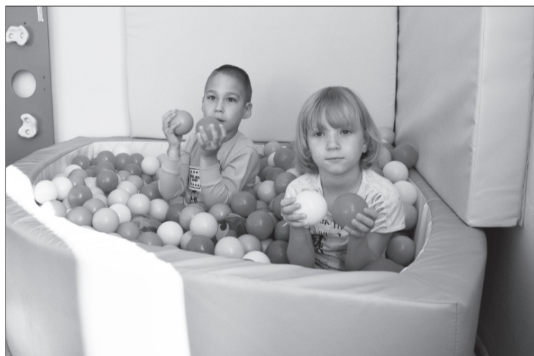
Дети с удовольствием знакомятся с игровыми комплексами.