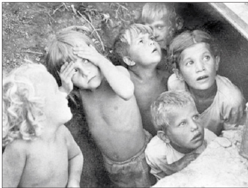
Сколько страха, боли, горя пережили те, чьё детство пришлось на годы войны

В декабре 1943 года немцы начали делать зачистку. Всю мясную