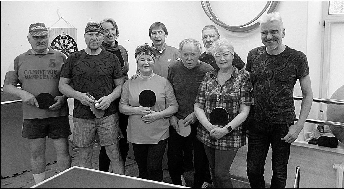
Пенсионеры Московского ходят в спортзал с удовольствием.