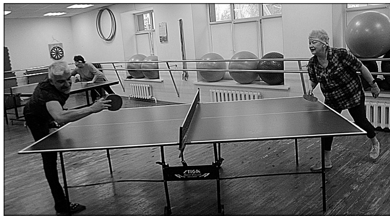
Теннис — игра азартная.

Хоть в залах и тесновато, но новичкам всегда рады. Одного из