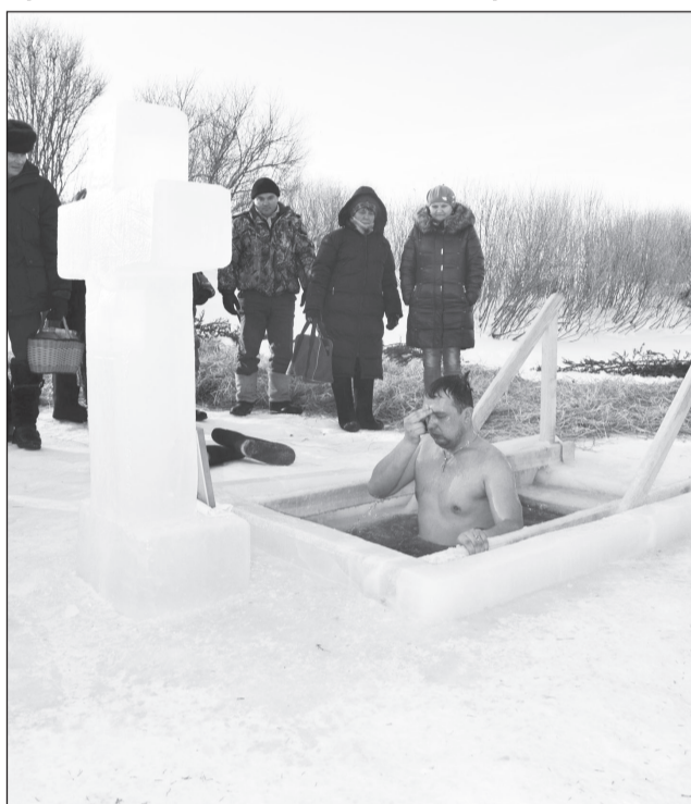
Ледяная купель на реке Емуртле.

Праздник Крещения в нашей стране издревле связан с народным обычаем – погружением в ледяную купель. С возрождением веры вернулась и эта традиция. В