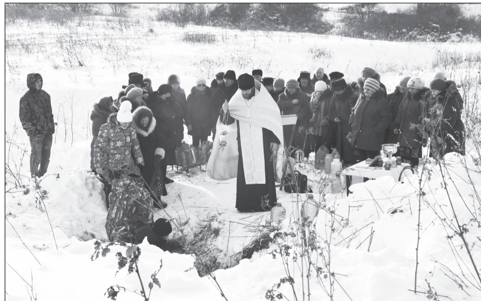
Освящение ключевой воды в Пятково.