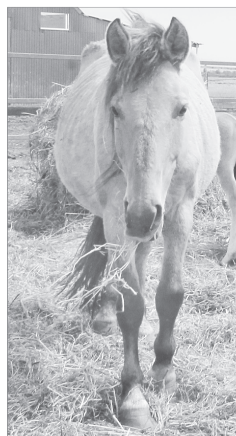
Лошадиные силы как мера успеха

- За счет увеличения муниципального бюджета мы улучшаем условия прожи-