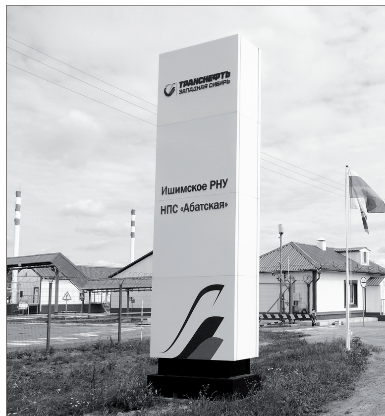
Стела НПС «Абатская»