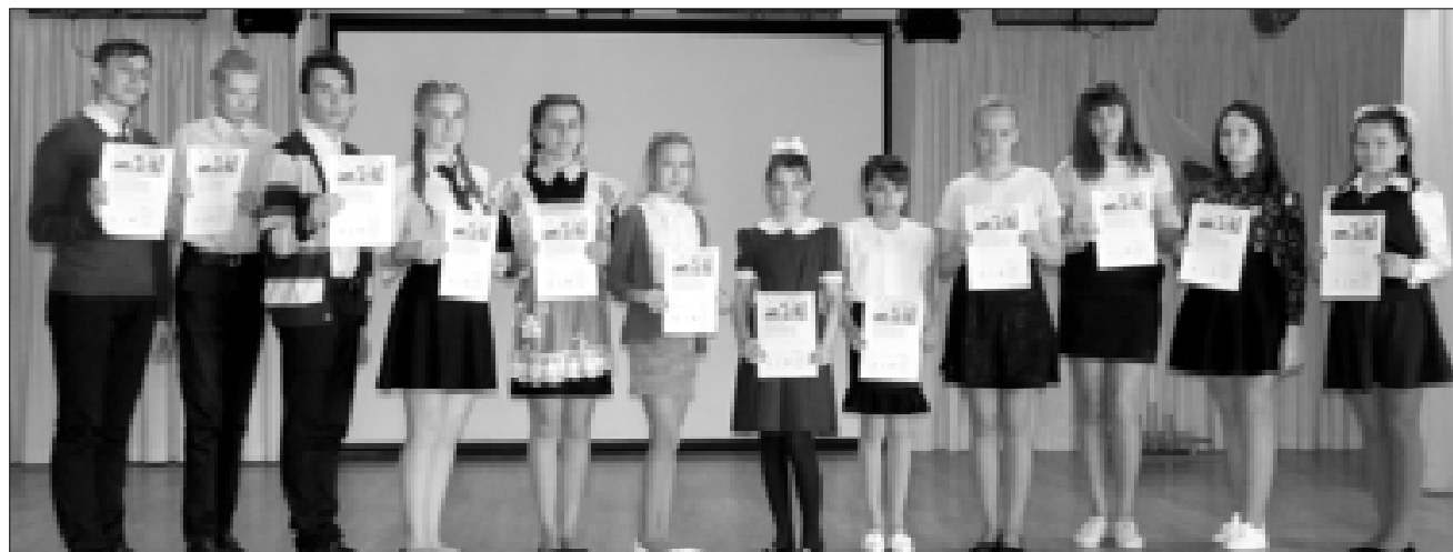
Обладатели наград муниципального этапа Всероссийского конкурса юных чтецов