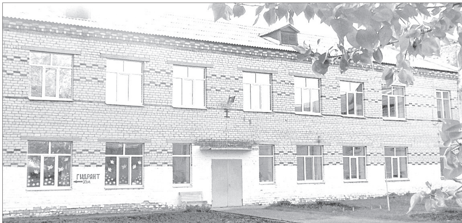
Старая Заводопетровская школа состоит из двух корпусов, один из которых построен в 70-х, а второй - ещё в XIX веке

века. Новый проект предусматривает возведение модульно-блочного здания, в котором помимо школьников будет заниматься и одна детсадовская группа.