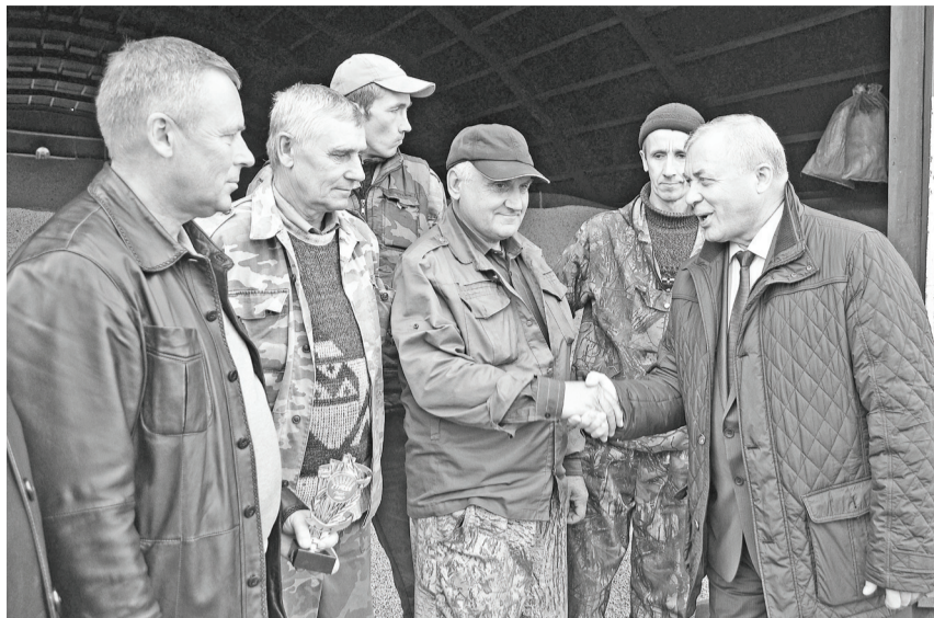
Поздравление с окончанием уборки – и снова в поле, работы ещё много.