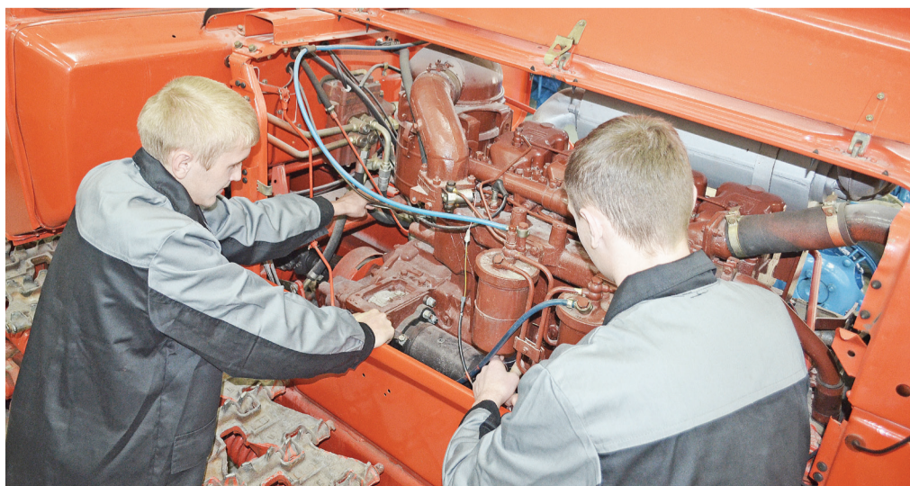
Из чего же состоит этот двигатель? Над этим вопросом думают студенты трактористы-машинисты.