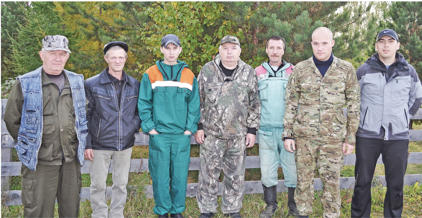
Коллектив Нижнетавдинского участка лесничества