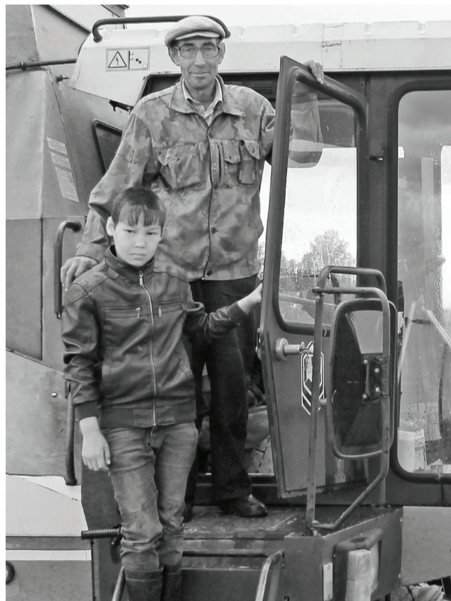
Этих родных людей объединяет любовь к технике и земледелию.