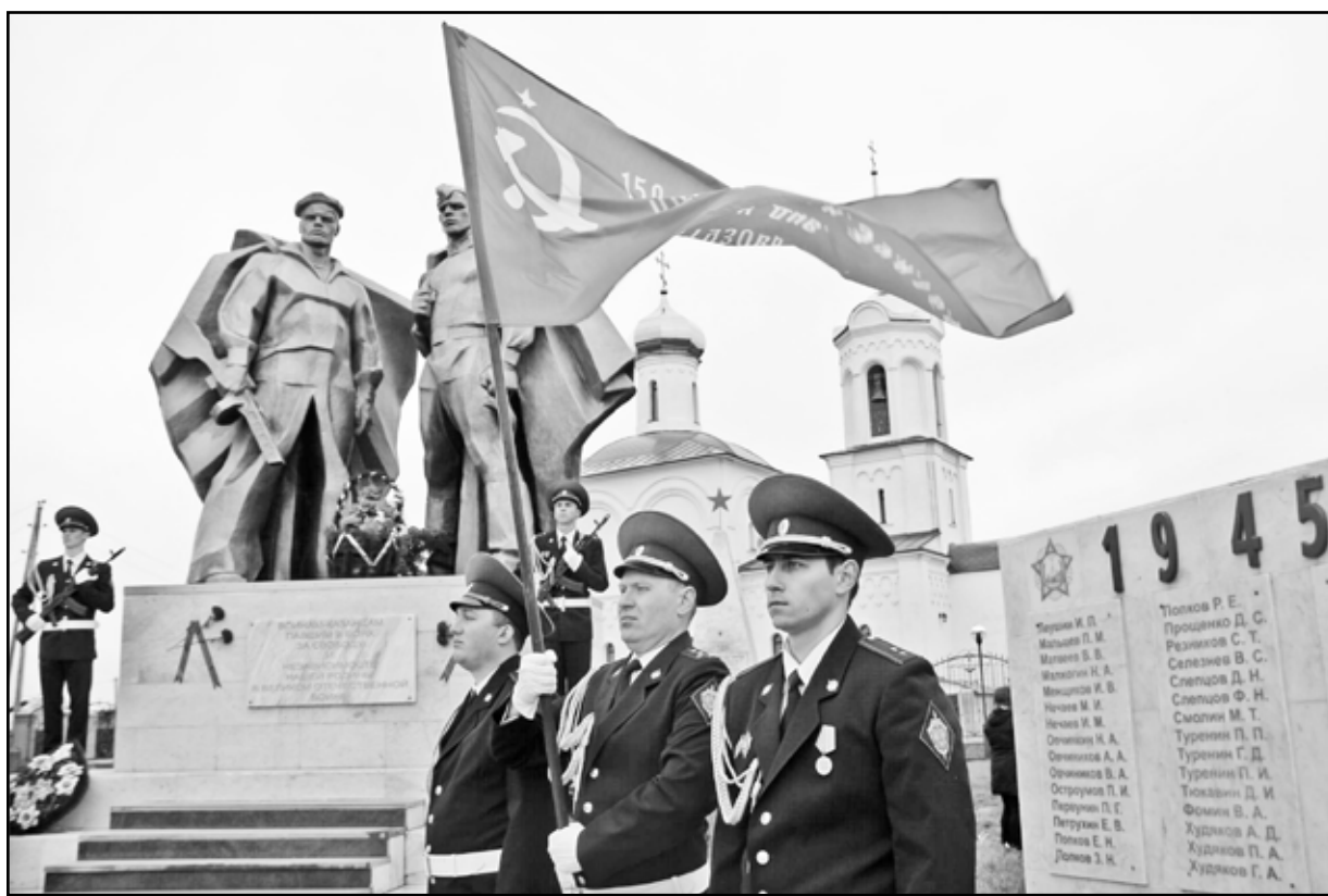
Жители Казанского района — истинные патриоты, которые дорожат историей, хранят традиции

Рост цен, вопросы трудоустройства и оказания медицинской помощи, а также ситуация в сфере ЖКХ — именно эти темы больше всего волнуют жителей региона. Такие результаты масштабного социологического исследования представил губернатор Владимир Якушев в ходе заседания Общественной палаты Тюменской области.