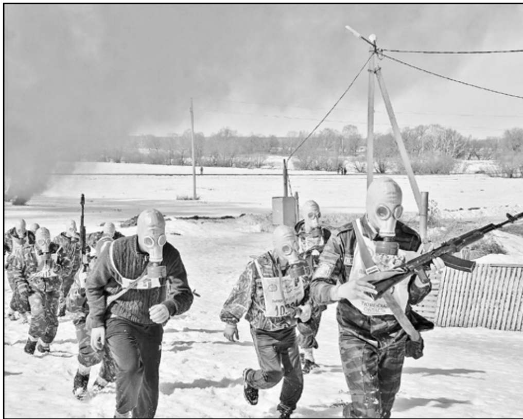
Марш-бросок в противогазах через задымлённую местность – задание не для слабаков

Здесь присутствовали реальные трудности: снег, грязь, слякоть, холод. И видно, что уже и ноги не бегут, и руки не держат поначалу не такой тяжёлый, как казалось, автомат. Но ребята как истинные бойцы терпели