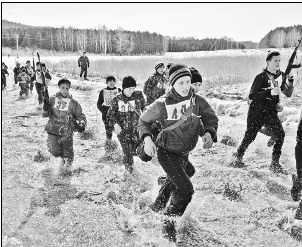
Бежать приходилось и по колено в ледяной воде