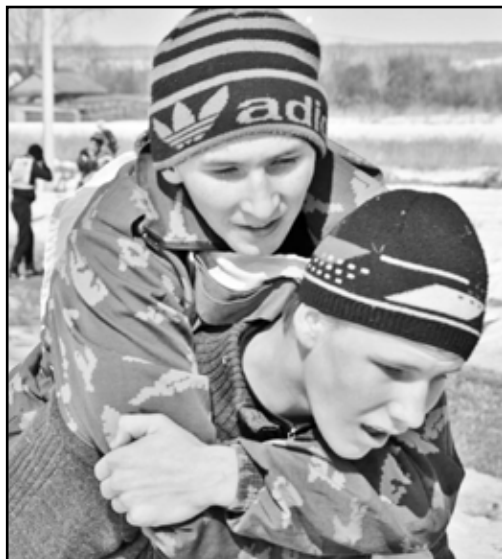
Друг никогда не бросит в беде