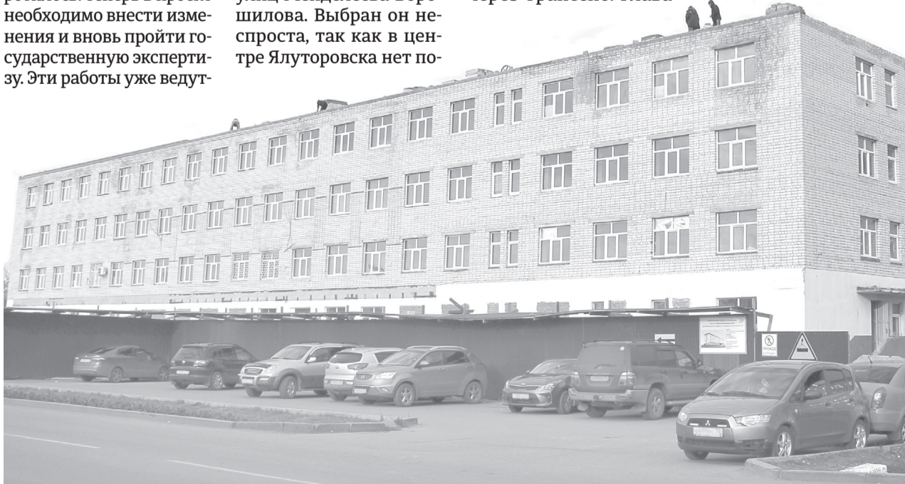
Работы по реконструкции взрослой поликлиники продолжились на этой неделе