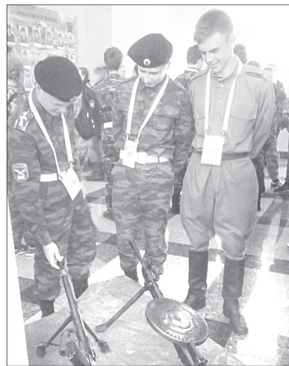
Петелинские ребята с интересом изучали трофеи времён Великой Отечественной, привезённые челябинскими школьниками из экспедиций