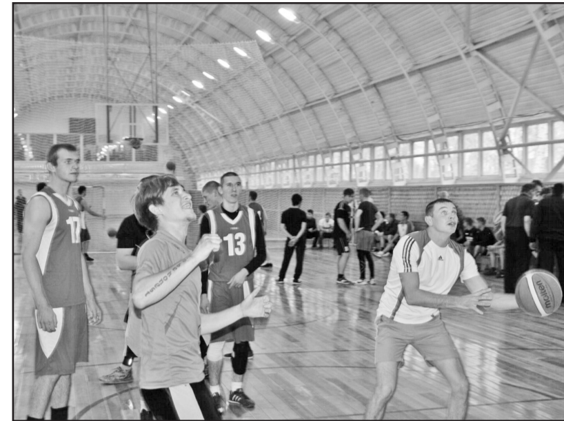
Баскетбол – игра азартная, зрелищная