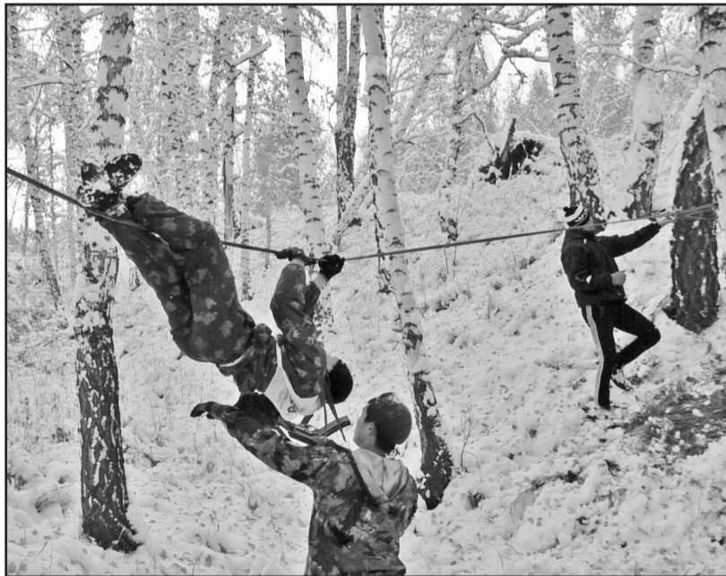
Навесную переправу все преодолели быстро и легко