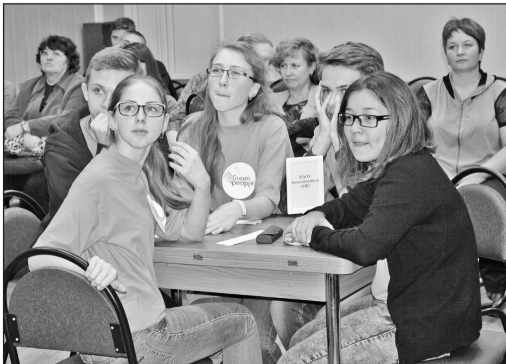
Игра захватила ребят

Районная экологическая игра «Сохраним нашу Землю голубой и зелёной» состоялась 28 октября в Казанском центре развития детей