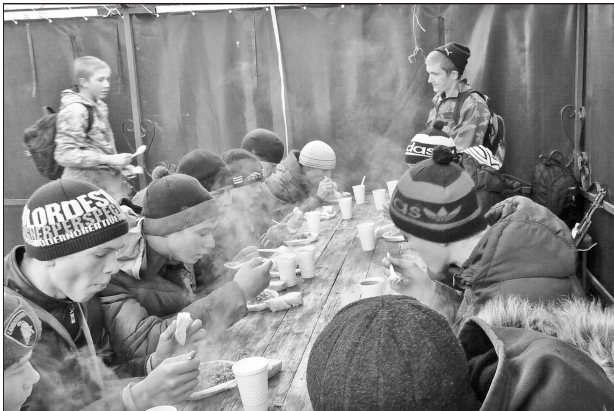
Содатскую кашу ребята уплетали с большим аппетитом