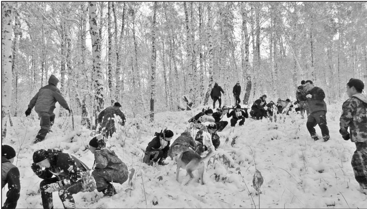
Во время марш-броска ребята выполняют команды инструкторов и преодолевают различные препятствия

Молодые люди, которым удастся пройти испытания и получить