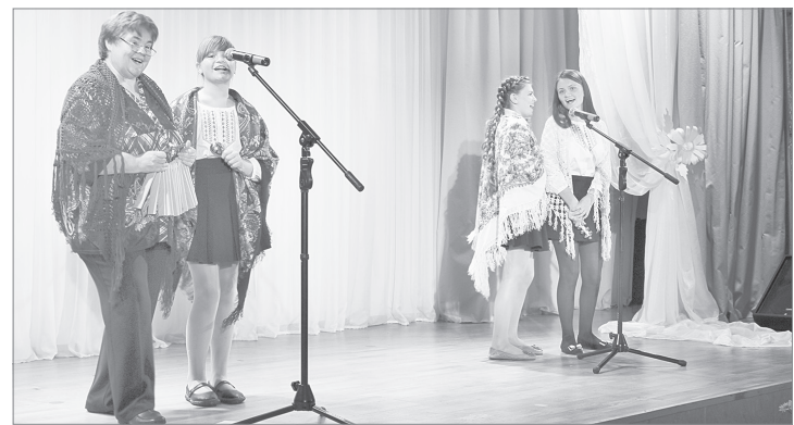
Выступает семья Зориных