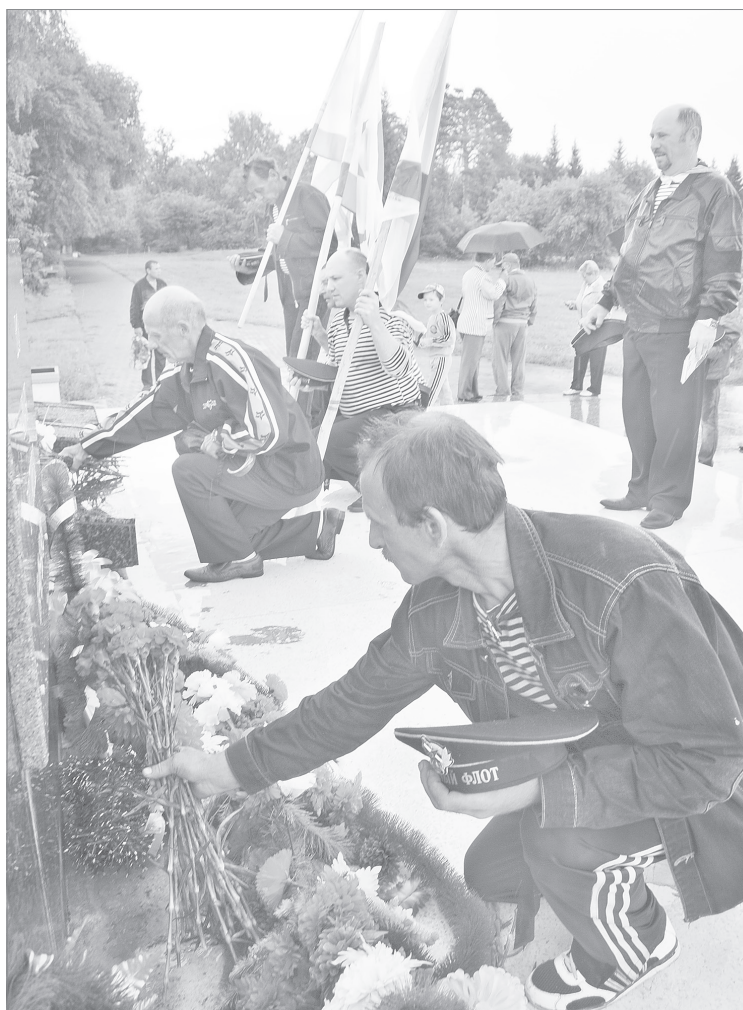
Павшим - память и почёт

Напомним, День ВМФ в нашей стране отмечается с 1939 года по инициативе выдающегося флотоводца, адмирала, Героя Советского Союза Николая Кузнецова. А истоки праздника относятся к августу 1714 года, когда корабли под командованием Петра I одержали свою первую победу. Тогда и появилась традиция выстраивать флотилию и палить из всех пушек.