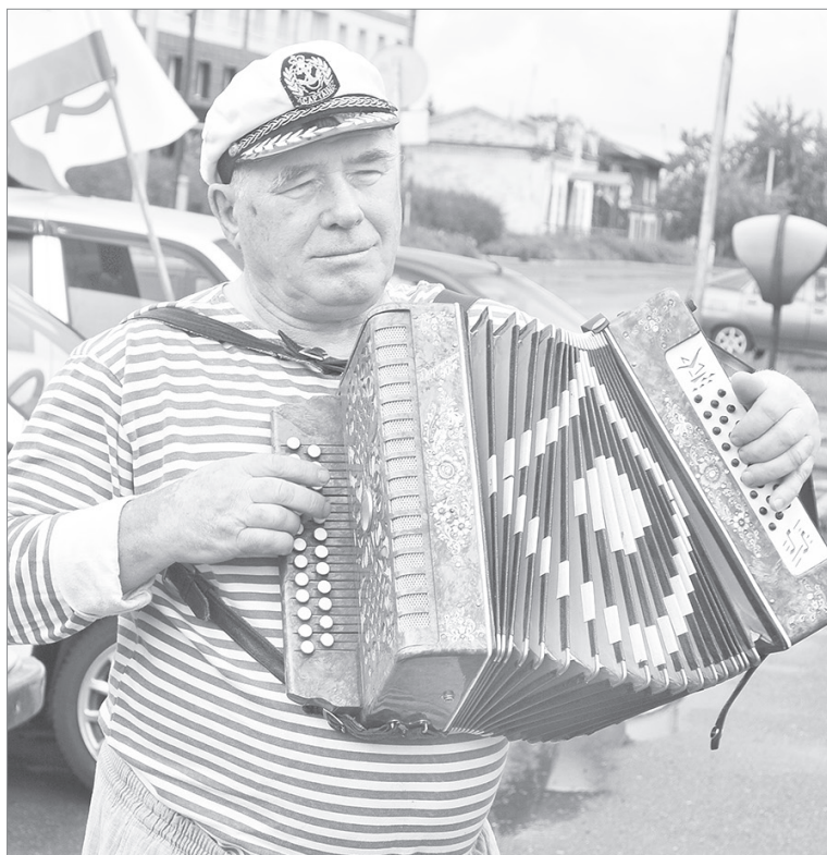
Разверни меха гармошка