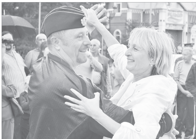
Закружились в вальсе пары