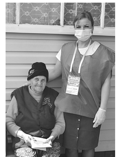
Волонтеры доставляли продукты и участвовали в акции «Георгиевская ленточка»