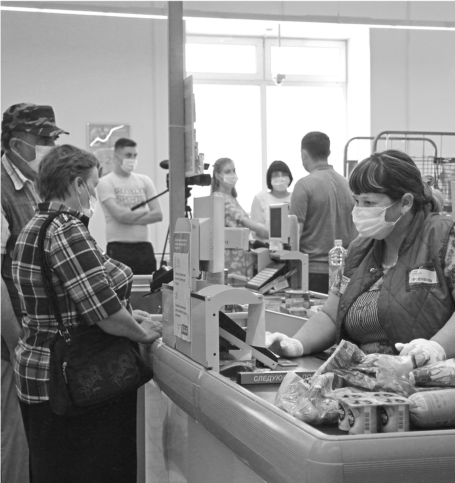
В магазине «Магнит» масочный режим соблюдают продавцы и покупатели