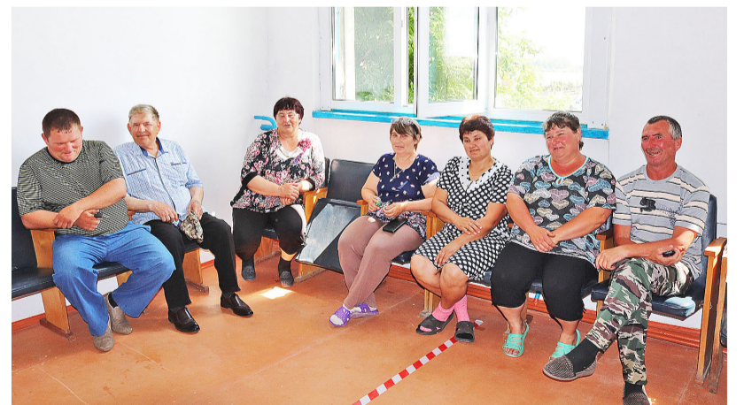
Общее мнение людей каждой территории базируется на улучшении жизни на селе

вания, на водозаборе установлены новые насосы, функционирует павильон очистки питьевой воды. Из числа вопросов селян затронуты договорные отношения на полив между предприятием и людьми, пользование водой без приборов учёта и другие, касающиеся качества предоставления коммунальных услуг.