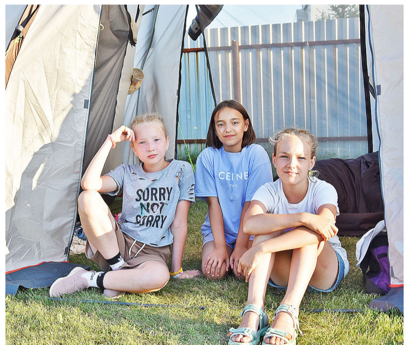
Жить в палатках – это здорово