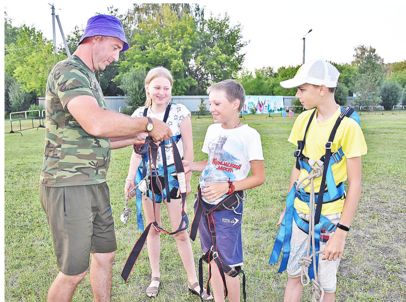
Прежде чем пройти туристическую полосу препятствий, нужно подготовить инвентарь