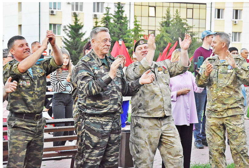
Каждый, кто пришёл на концерт, получил заряд положительных эмоций и хорошее настроение

– Приятно находиться на сибирской земле. Неделю назад был в Омске на фестивале «Автомат и гитара», сегодня – у вас. Рад, что встретил старых друзей. Молодцы организаторы, что проводите такой фестиваль, который объединяет по-