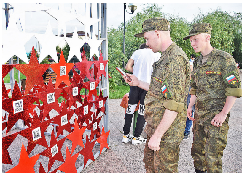
Тематическая площадка районной библиотеки привлекла внимание многих отдыхающих

ющих солдат со всей России, и, конечно, он важен для подрастающего поколения.