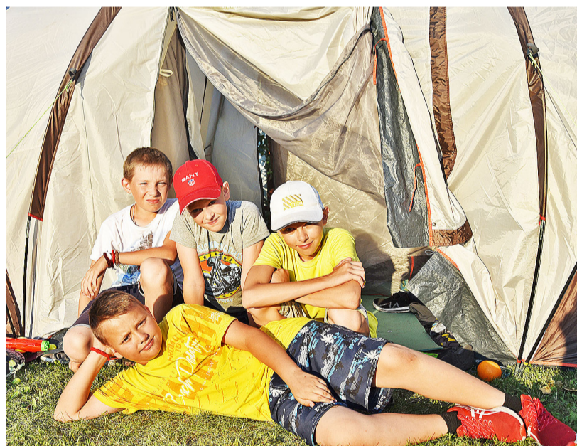
Мальчишки признаются, что впервые вдали от дома и без присмотра родителей. Но это их не пугает

По словам начальника лагеря Светланы Филипповой, дети питались пять раз в день. Каждый день что-то новое, блюда практически не повторяются. В лагере работает медик, который следит за состоянием детей. В свободное время мальчишки и девчонки участвовали в мастер-классах по выжиганию по дереву, играли в футбол, волейбол, лазертак, настольные игры. И, конечно, вечерние посиделки у костра, где можно пожарить картош-