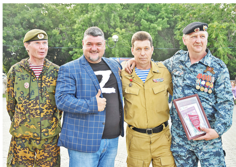
Постоянные участники мероприятия и те, кто приехал впервые, восхищались гостеприимством казанцев