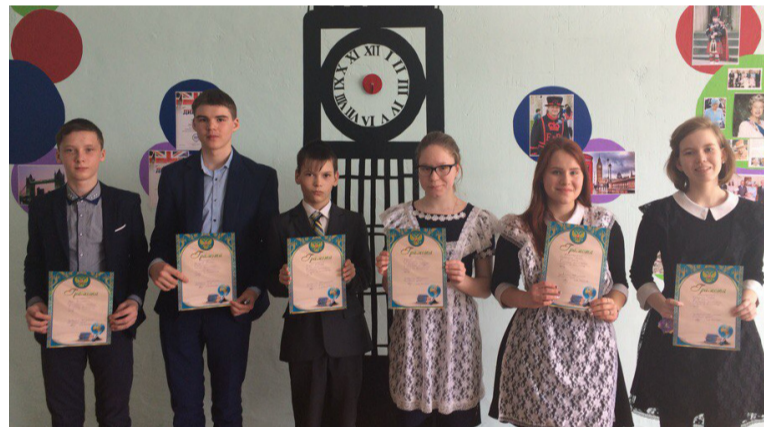
Участники фонетического конкурса по английскому языку.

– Все дети очень хорошо прочитали произведения. Видно, что старались, вложили много труда. Приятно было слушать. Думаю, что все участники почерпнули для себя много интересного и полезного. С большой радостью ждём их на следующее мероприятие. Оно, кстати, тоже обещает быть не менее увлекательным – это конкурс «Евровидение», который состоится в конце апреля в бархатовской школе. Ждём открытия новых талантов!