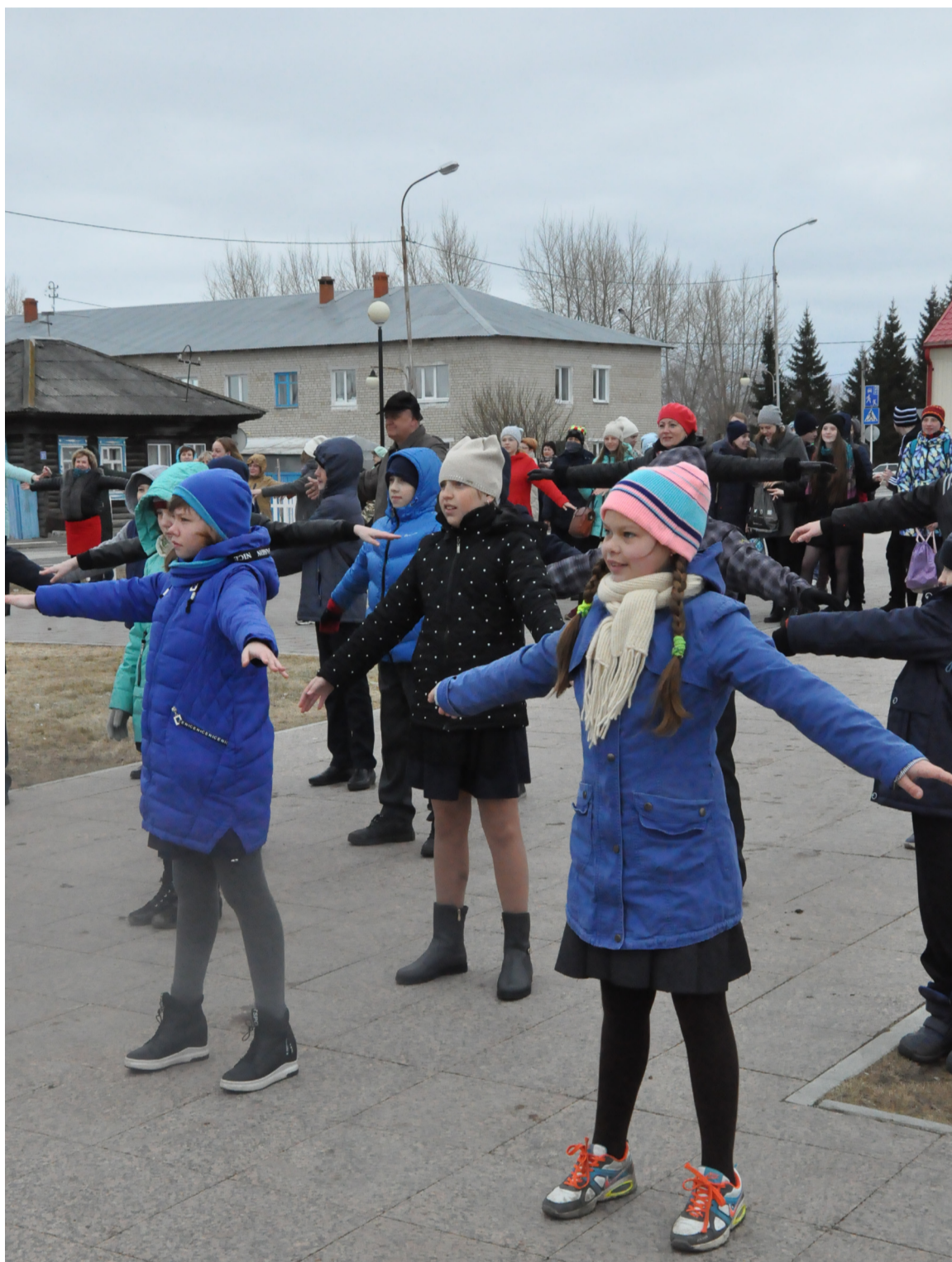
|| Жители райцентра получили заряд бодрости.