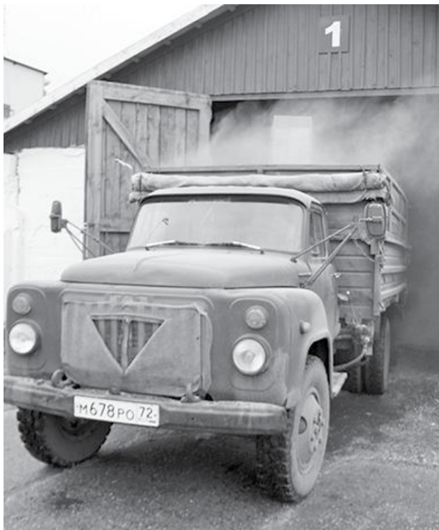
* Вывоз зерна на сортировку