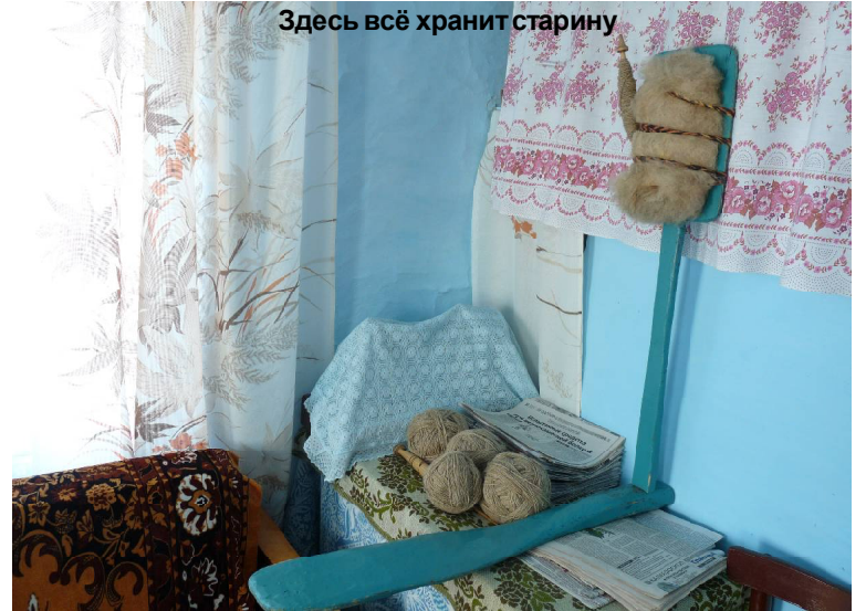
Здесь всё хранит старину

Расхождение в датах ставило меня в тупик. Если верить дате, указанной в «Исторической справке» (1886 год), то выходило, что семья бабушки оказалась в селе Ермаки через