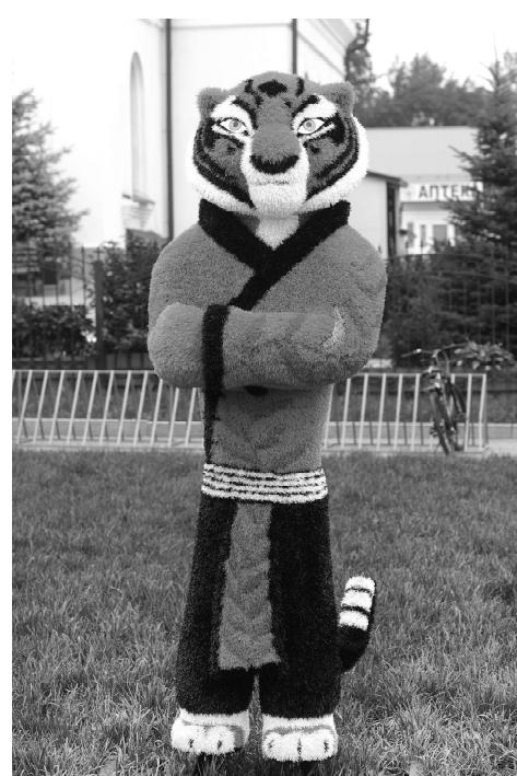
Мастер Тигрица притягивает взгляды взрослых и детей