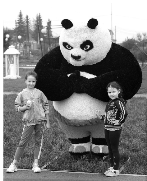
Кунг-фу панда - любимца детворы