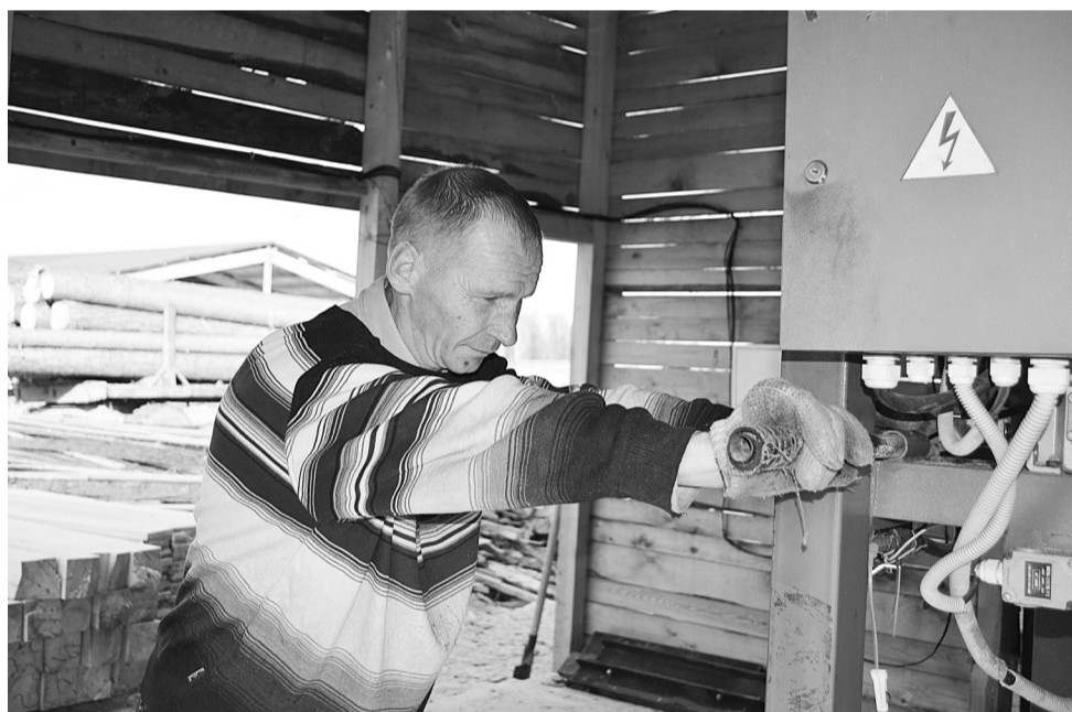
На пилорамае ООО «Триада-Лес» работа кипит с утра до вечера. Ленточный станок «Тайга» может переработать пять-семь кубов древесины за смену.