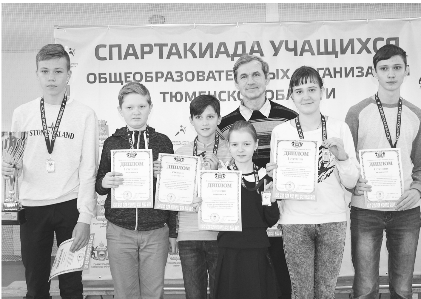
Сборная команда Нижнетавдинского района на первой ступени пьедестала.