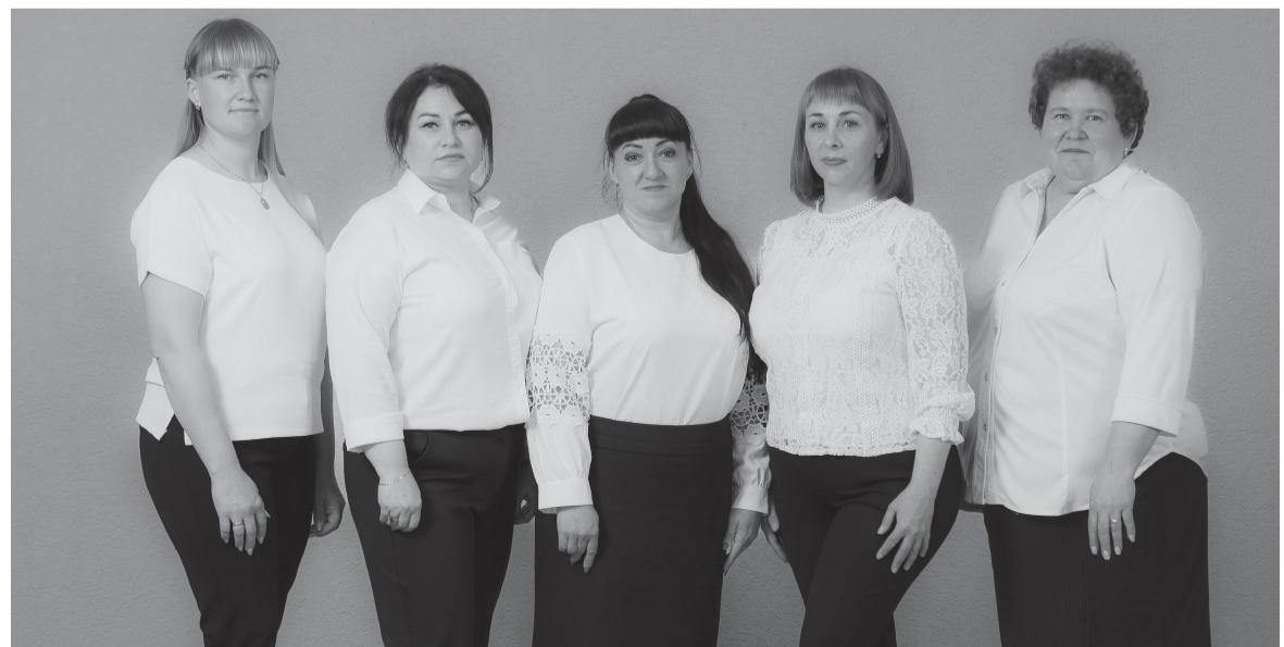
■ На снимке: специалисты районного суда