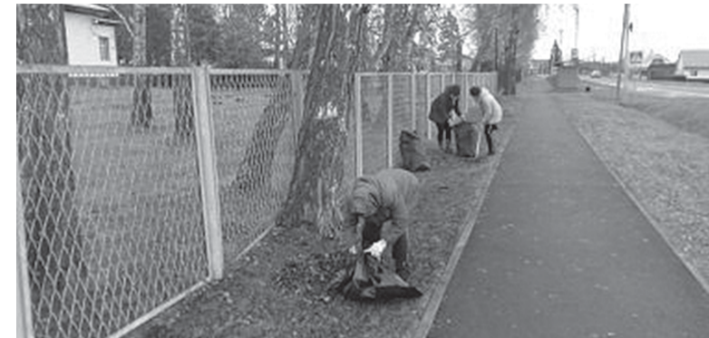
■ Теперь на прилегающей к храму территории порядок

— Хочу выразить слова благодарности от сорокинцев протоиерею Владимиру и совету Храма. В последние годы на прилегающей территории царит чистота и