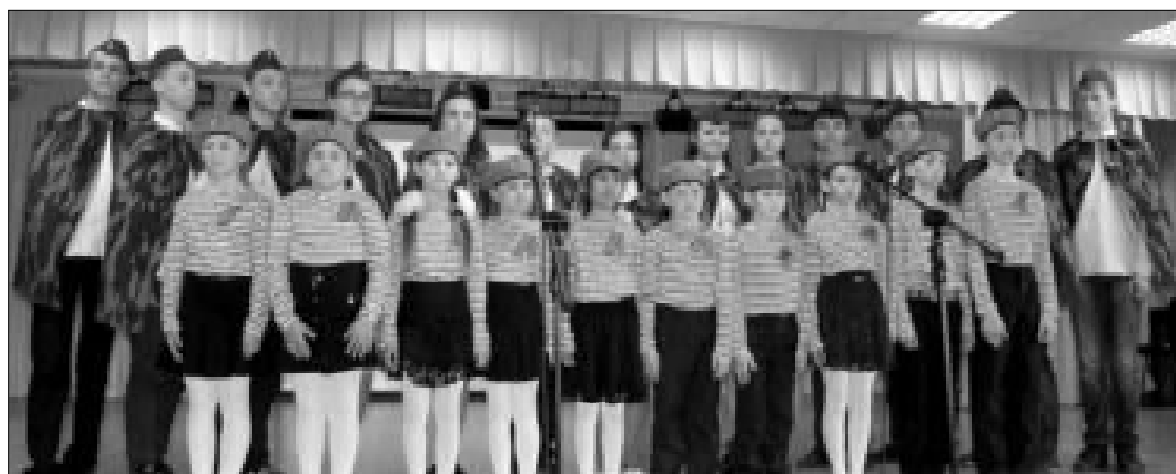
Сводный хор Калмакской школы