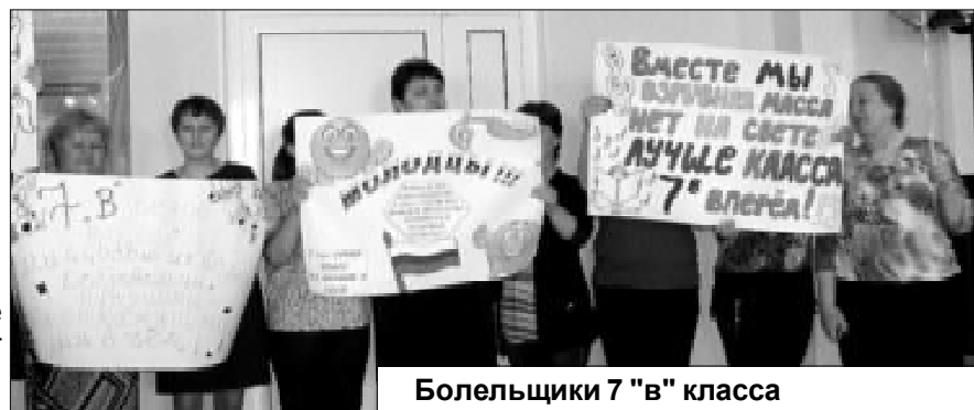
Болельщики 7 "в" класса

Сводный хор 5 «б» и 5 «в» классов из Армизонской шко-