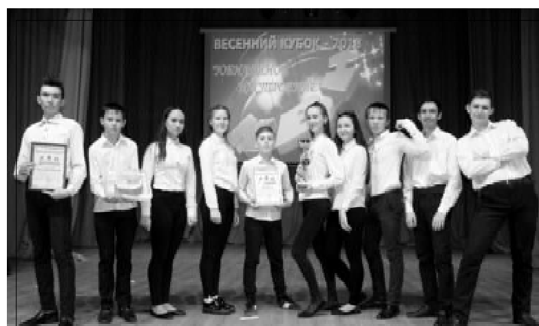
Победители КВН - команда "Оба - на"