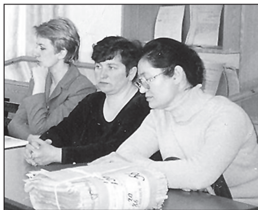
В читальном зале Тобольского госархива