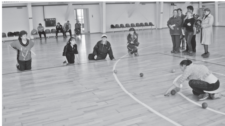
Идет спортивная игра на точность (бочча)