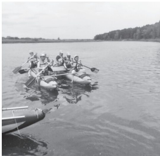
Вагайская команда на «Робинзонаде»