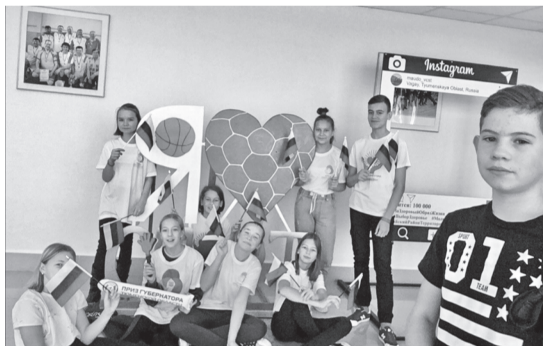
Волонтеры Вагайской средней школы

На сегодняшний день это движение объединяет 370 волонтеров из 17 отрядов, которые функционируют на базе Вагайской, Зареченской, Дубровинской, Шишкинской, Бегишевской, Осиновской, Супринской, Тукузской, Шестовской, Юрминской, Второвагайской, Птицкой, Карагайской, Казанской, Аксурской, Первомайской школ, Тобольского многопрофильного