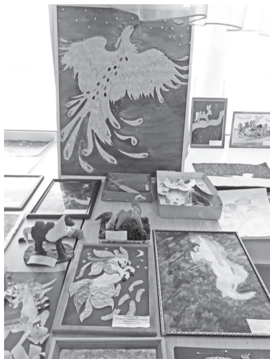
Выставка детских работ

и в Зареченской средней школе. В заранее установленный день в нашу школу прибыли учащиеся Тукузской, Казанской средних, Митькинской начальной школ. В начале мероприятия ведущие рассказали об авторе сказки и его произведении, сопровождая информацию презентацией.