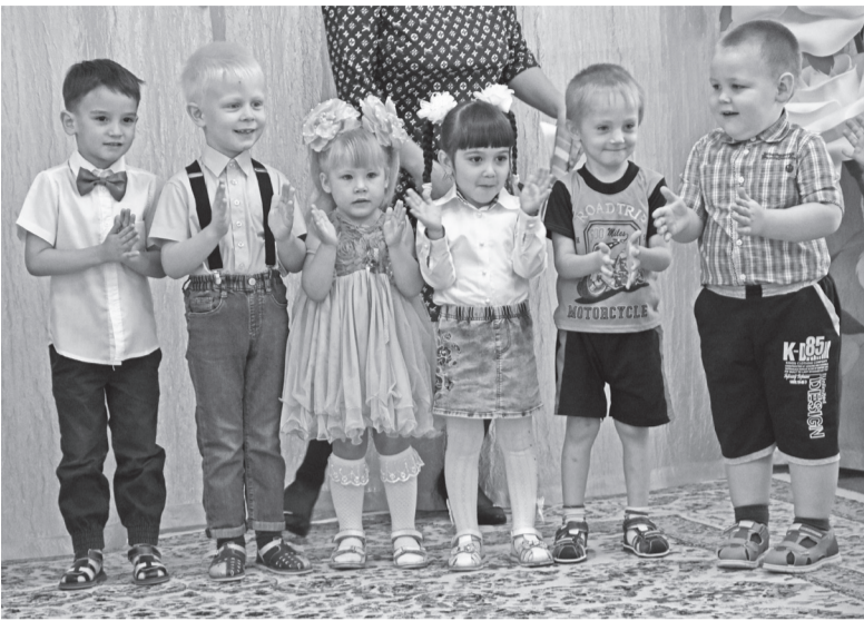
«С праздником, мамы и бабушки!» - говорят воспитанники «Сказки»

День матери – прекрасная возможность уделить внимание своим милым мамам и бабушкам, самым добрым, чутким, нежным, заботливым. В преддверии этого замечательного праздника в детских садах районного центра прошли утренники, посвященные этому дню.