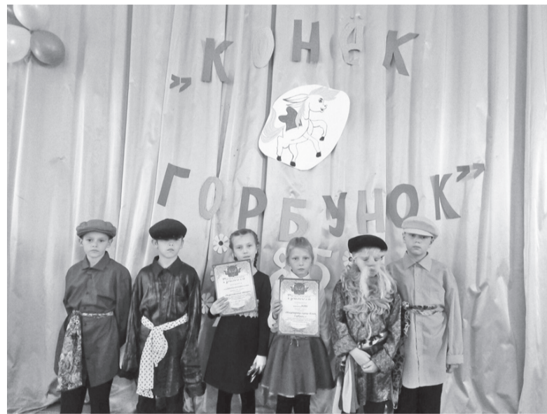
Учащиеся 3 класса Зареченской школы – участники постановки по сказке «Конек-Горбунок»

Все победители и призеры были награждены грамотами. А