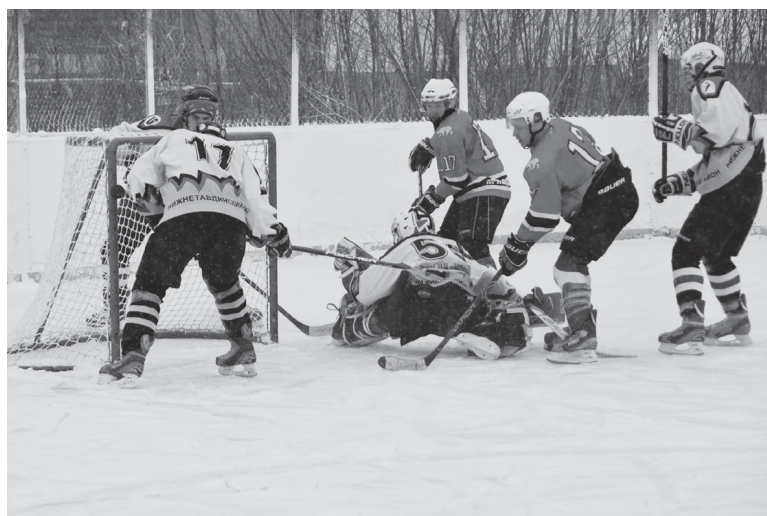
Команда Ярково атакует ворота соперника

Отметим, что состоявшаяся ранее в Нижней Тавде первая игра между этими же командами завершилась со счетом 7:4 в нашу пользу. Таким образом, теперь принципиальные соперники ярковчан взяли реванш. Напомним, что в своей зоне сборная Ярково идет на четвертом месте – впереди команды из Ялуторовска, Тобольска и Тюменского района.