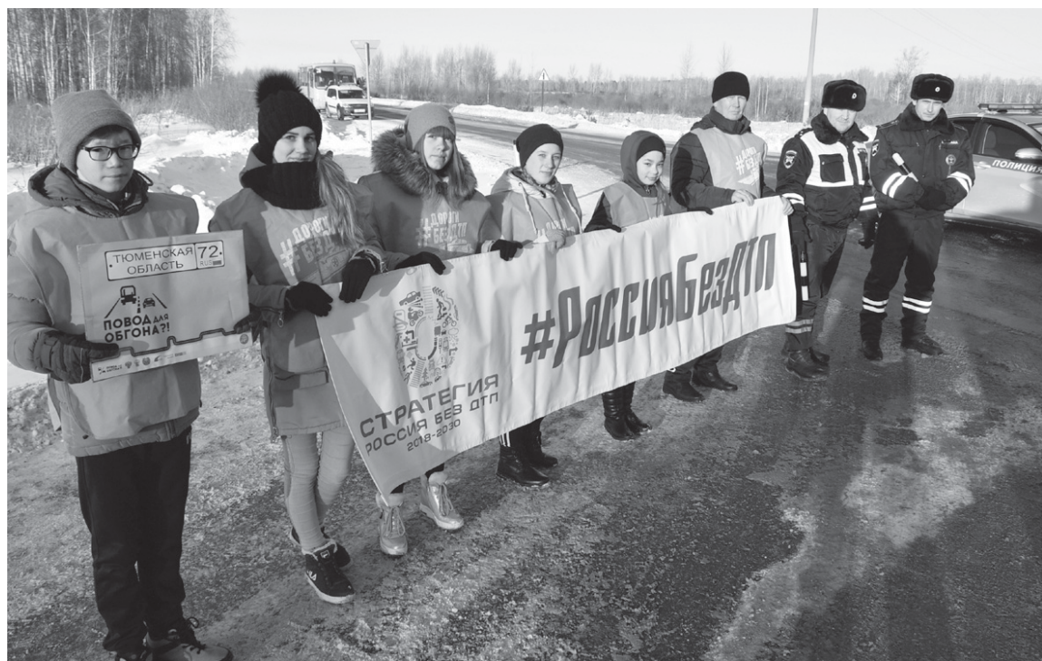
Предупреждение водителям от школьников Староалександровки