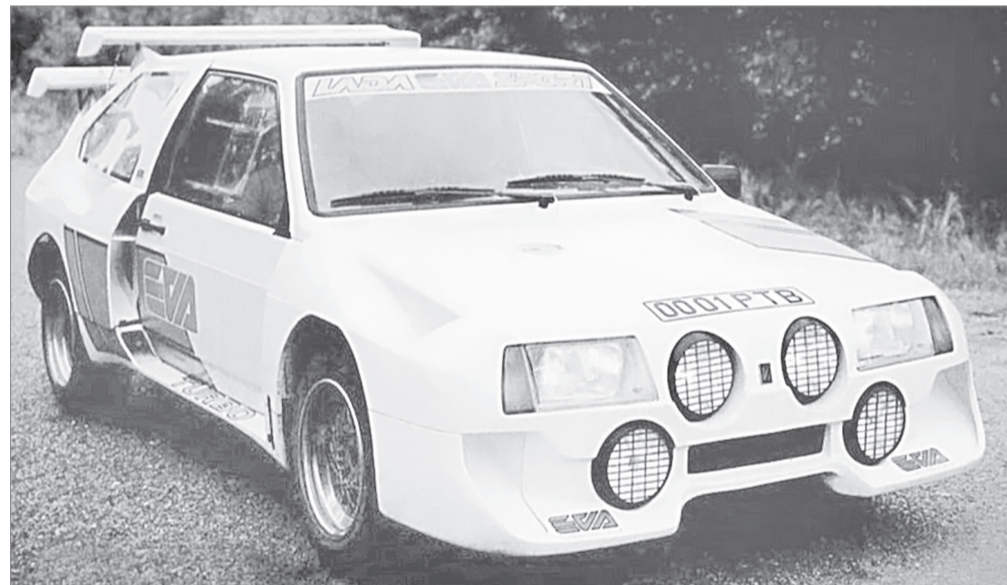
LADA EVA образца 1986 года выглядела как авто из будущего