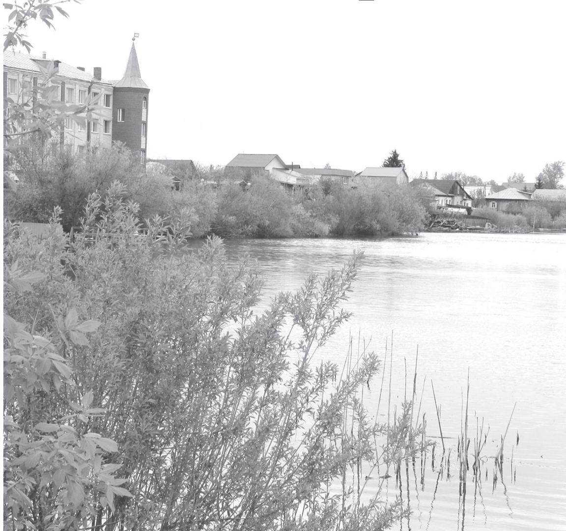
Озеро Бабановское - как катализатор, воды пока немного