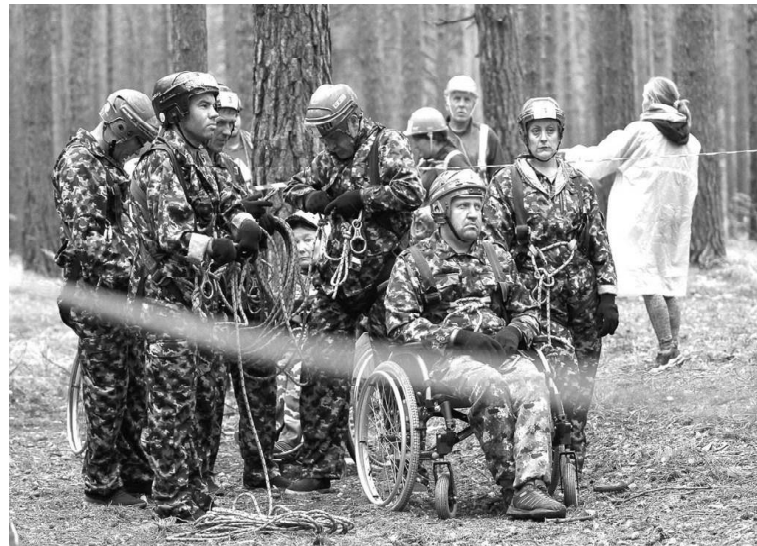
➤ Пешеходная дистанция

ние, радость, возможность проявить свои способности и раскрыть новые.