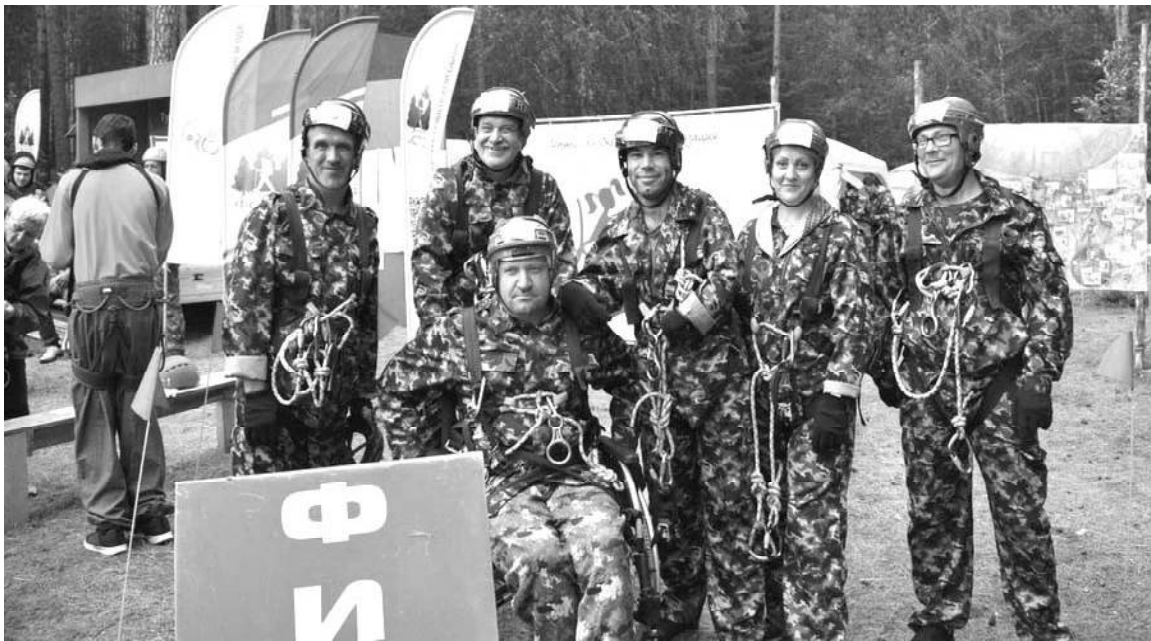
➤ Команда Викуловского района

Состоялся областной фестиваль-слёт для людей с ОВЗ «Робинзоада-2022»