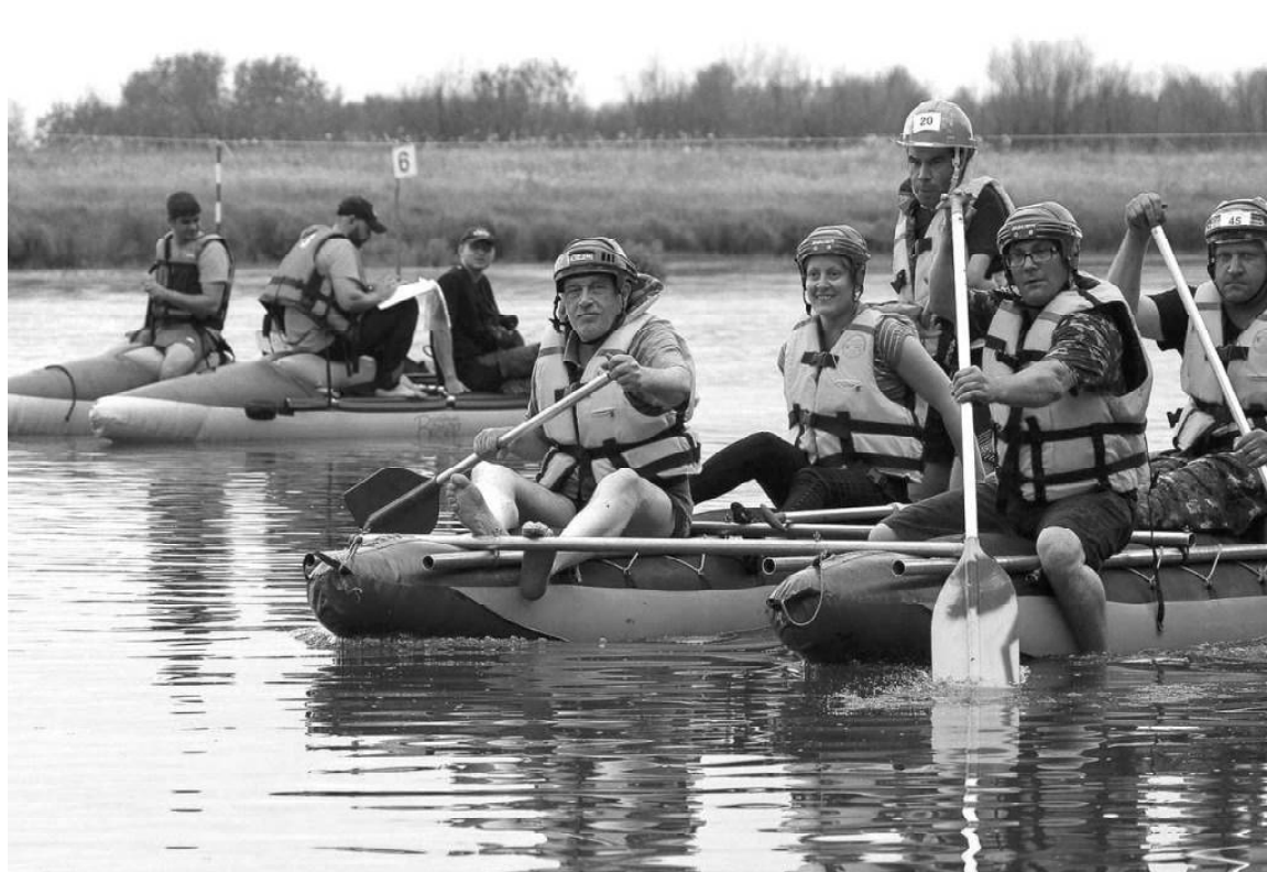
➤ Водная дистанция

Фестиваль состоял из нескольких соревнований. Одно из них – спортивный туризм – пешеходная дистанция. Траверс склона, вязка узлов, спуск и подъём по склону, переправа по бревну и верёвке и так далее. Интересно и захватывающе! На природе, в живописном месте. Ещё одно соревнование – прохождение водной дистанции. На байдарках нашей команде тренироваться негде. Кто-то, конечно, уже плавал на них, для кого-то это было открытием. Столько эмоций! Был и рыболовный спорт. Рыбу ловили поплавочной удочкой. Это удовольствие и азарт, радость общения с природой. Ещё один этап для команд –