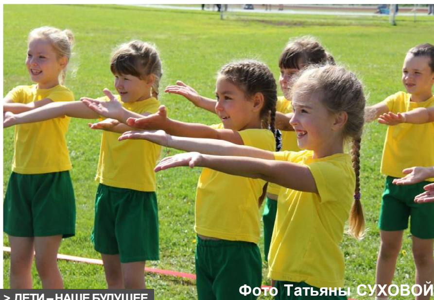
&gt; ДЕТИ – НАШЕ БУДУЩЕЕ