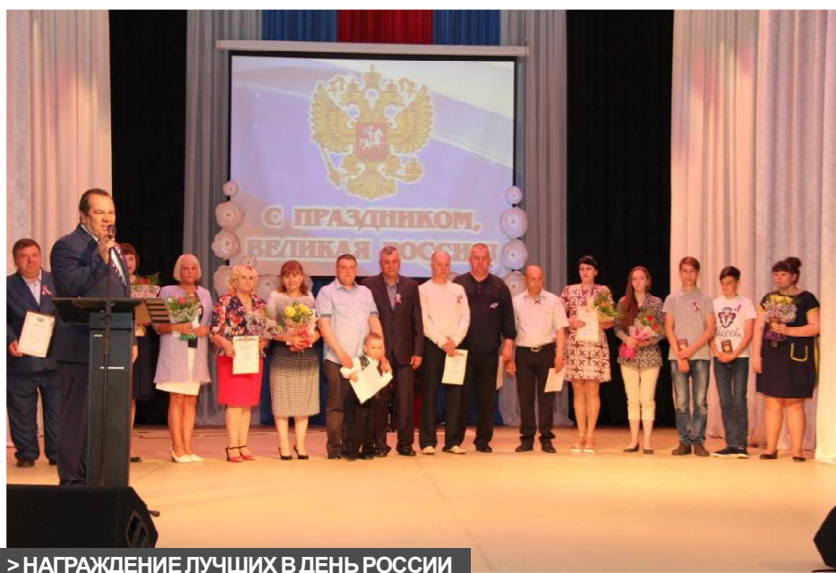
&gt; НАГРАЖДЕНИЕ ЛУЧШИХ В ДЕНЬ РОССИИ