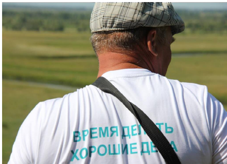
➤ Такой девиз у калининцев!