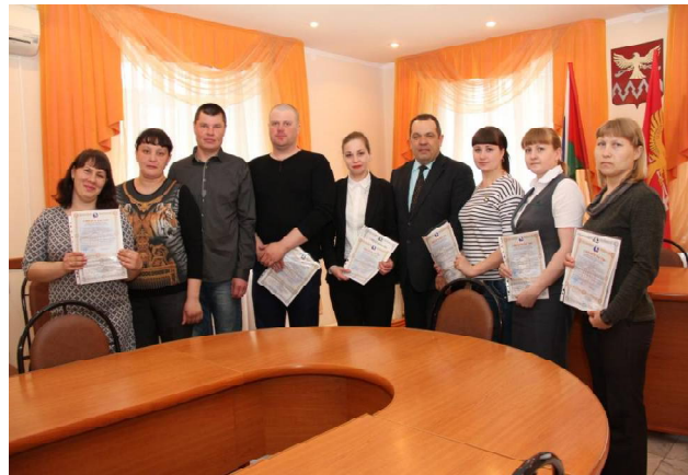
➤ Молодым семьям вручили «жилищные» сертификаты.

- Народный фольклорно-этнографический ансамбль «Вячорки» отметил 30-летний юбилей. Ровно столько лет коллектив поёт старинные белорусские песни, привезённые в Сибирь белорусами-самоходами.