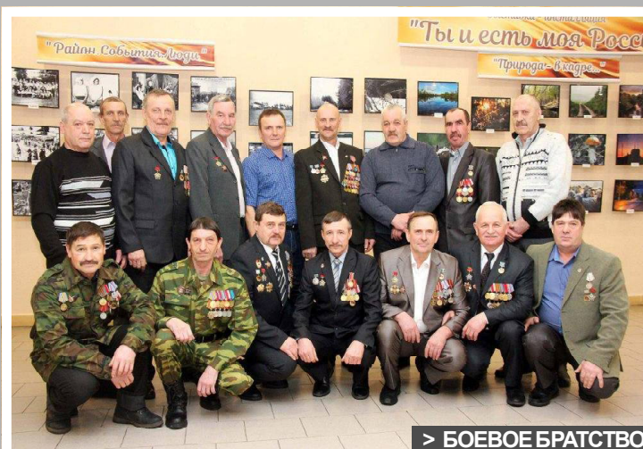
&gt; БОЕВОЕ БРАТСТВО