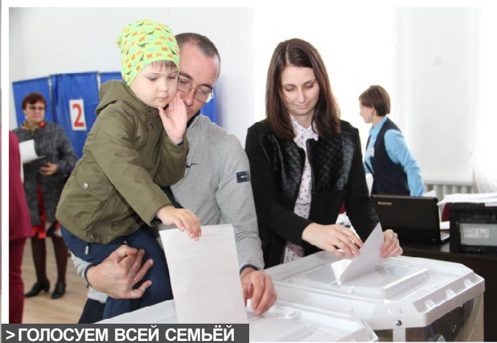
&gt; ГОЛОСУЕМ ВСЕЙ СЕМЬЕЙ