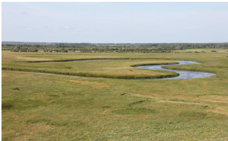
➤ Знаменитое озеро Сердце.