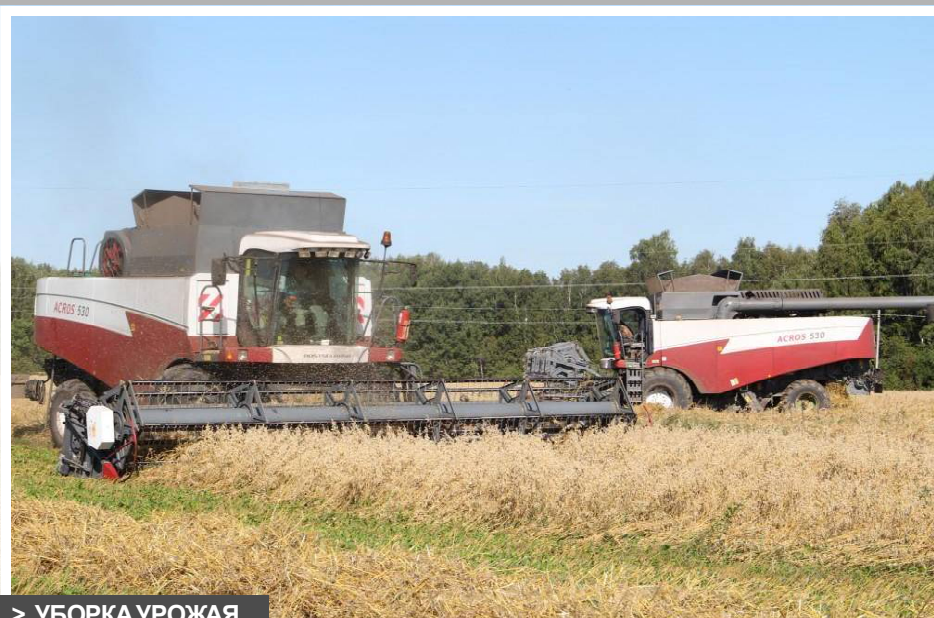
&gt; УБОРКА УРОЖАЯ