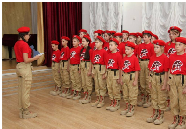
➤ Первое поколение юнармейцев.

- 25 сентября при Викуловском центре творчества было создано отделение Всероссийского детско-юношеского военно-патриотического движения Юнармия. Записаться в ряды юнармейцев пожелали 25 ребят. Они занимаются физической, строевой и медицинской подготовкой, изучают исторические и боевые традиции Отечества, основы безопасности.