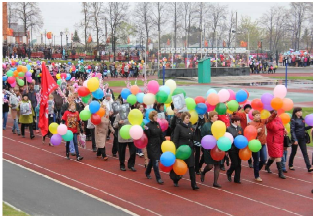
➤ Празднование Дня Победы.

- В феврале запустили внутрипоселковый газопровод в сёлах Каргалы, Одино и Малышево. В июне были газифицированы ещё два населённых пункта: Рябово и Шешуки. Чуть позже природным газом стали пользоваться ещё 400 семей викуловчан – газифицировали 10 улиц райцентра.