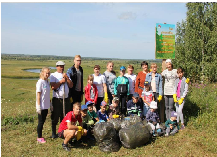
➤ Волонтеры на Собачьей горе.