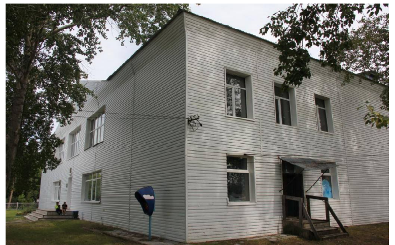
➤ Балаганская АТС.