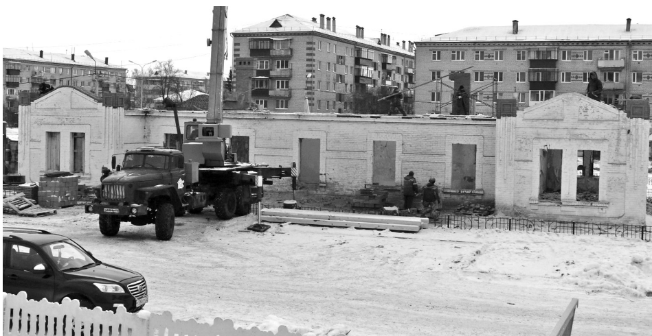
• Декабрь 2018 год. Заводоуковск, ул. Вокзальная, 44, бывшая железнодорожная казарма.