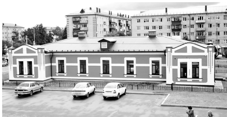
• Август 2019 год. В это историческое здание планируют перевести краеведческий музей.