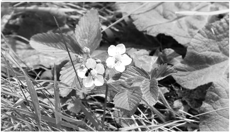
* Ягода в этом году уродится...

Окна, двери ПВХ с монтажом и без монтажа, ремонт окон, стеклопакетов, замена резинки, замена кровли, г.Омск. Обр.: т.т. 8 9503305050, 8 9236903242.