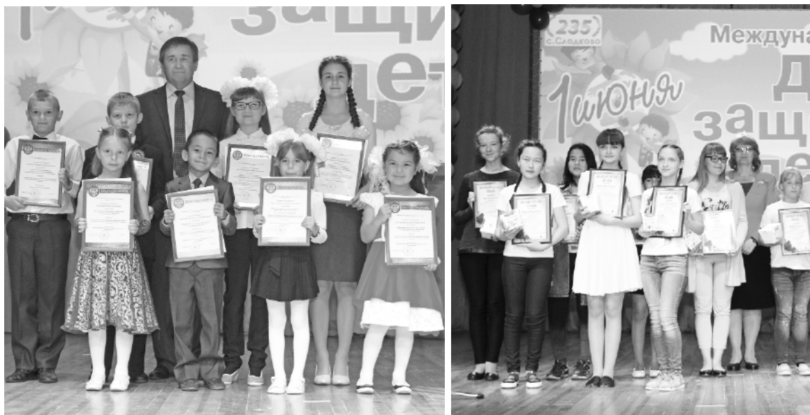
* Заслуженные награды для победителей.