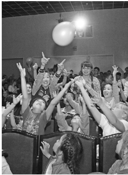
* Конкурсы прошли на ура!