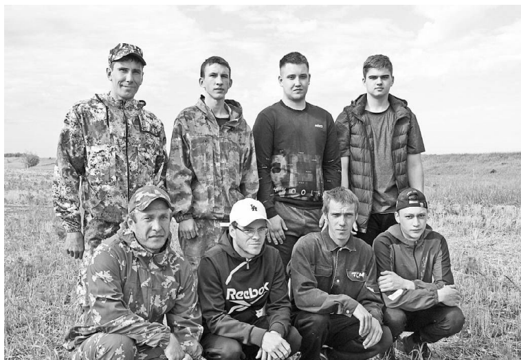
➤ Участники конкурса