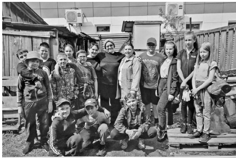
➤ Волонтеры у ветерана труда

Сейчас мне самой 80 лет – ветеран труда, учитель музыки. Тяжело уже все работы в хозяйстве делать самой. Надежда на помощь молодых, которых сейчас называют волонтерами (зачем? по-другому их называют тимуровца-