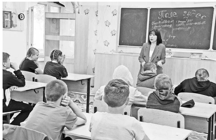
В Поддубровинской школе