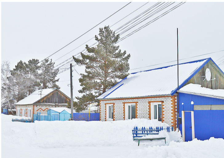
В селе Казанском одна из улиц названа в честь героя