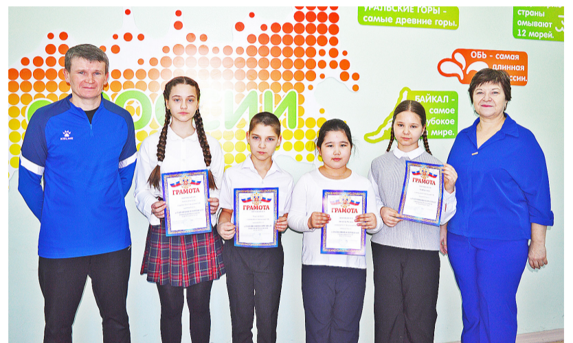
Казанские школьники и их педагоги-наставники рады полученным результатам

чили дипломы и денежные сертификаты, но самое главное – ребята получили новые знания и возможность проверить себя. Участие в предметной олимпиаде – не только