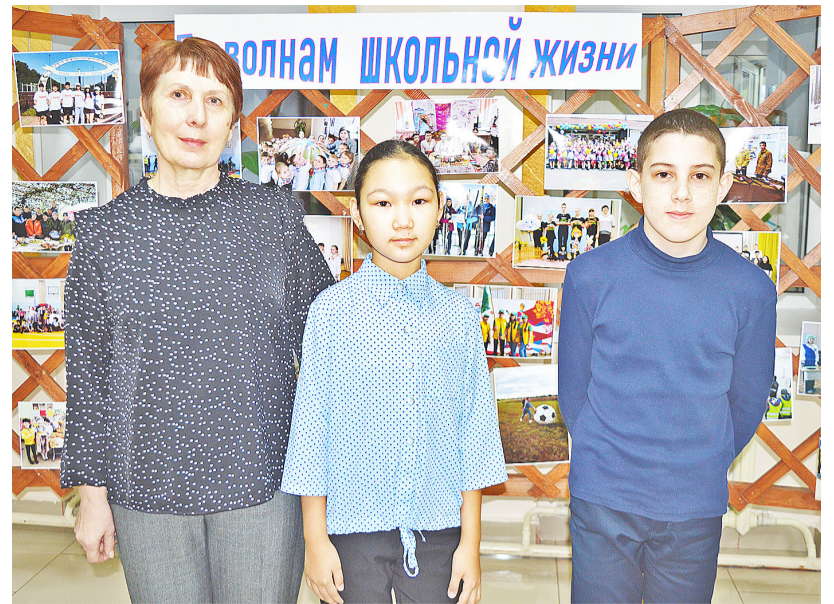
Новоселёвцы готовы к областным состязаниям

Победителям и призёрам муниципального этапа олимпиады вру-