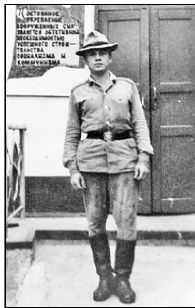
Как под городом Шамхором Вдаль смотрел я ясным взором

Командир роты, не дочитав четвертой страницы, заорал благим матом и послал меня по маршруту, определяемому тремя словами.