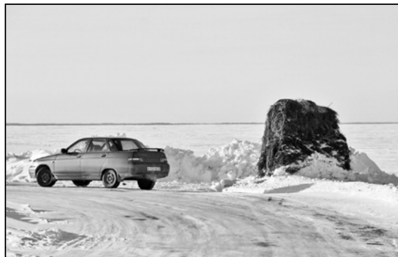
Везут сладчанцы навоз на свой большак, на перекрёсток...

Дежурный «косарь» Олег ДРЕБЕЗГОВ