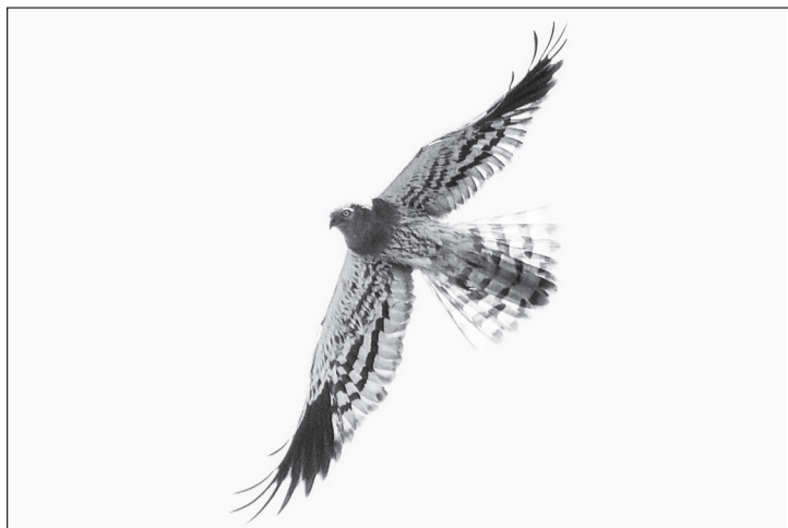
Краснокнижник луговой лунь.