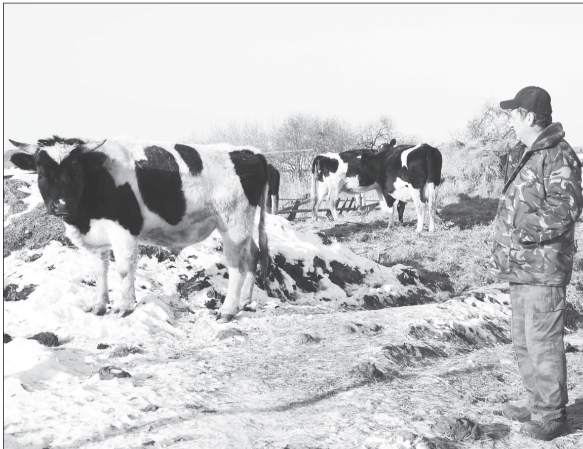
Хозяйственники задумываются над тем, что сейчас выгоднее производить.