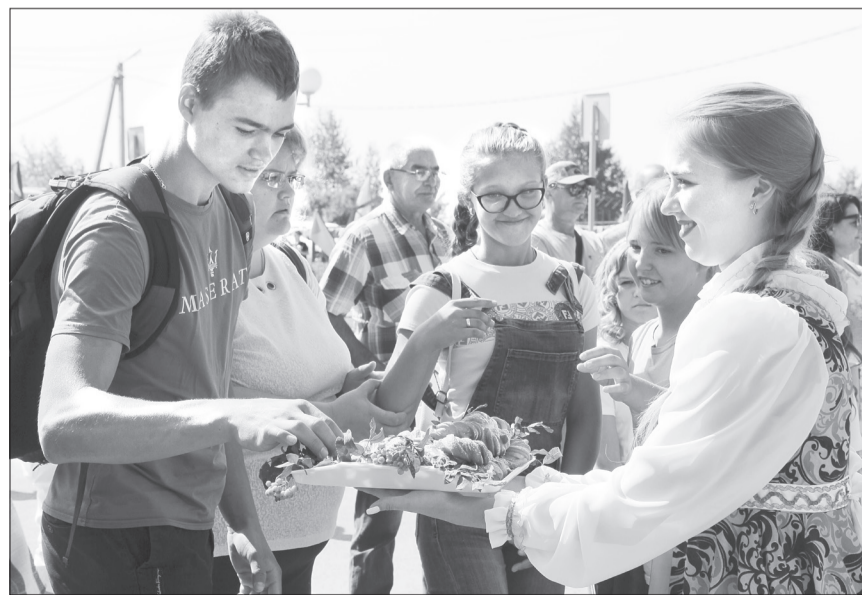
На торжественном открытии зрителей угощали вкусностями