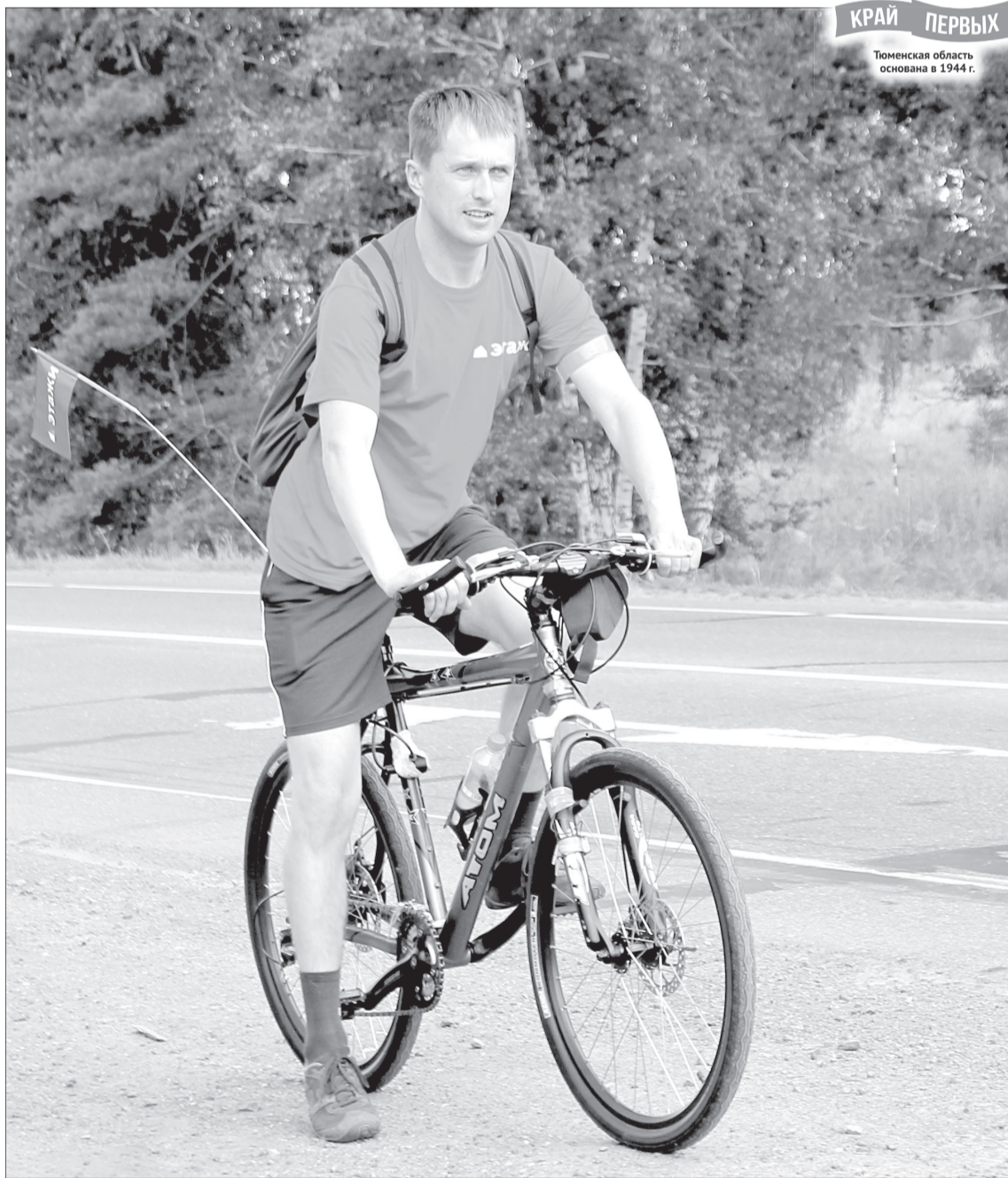
По пути велосипедист заезжал и в наш город

- Пока едешь, о чём только не подумаешь: о работе, жизни, природе, которая тебя окружает. На этой трассе бываю часто, так как родители живут в Армизонском, но из машины местных красот вообще не замечаешь, а на велосипеде видишь каждую букашечку и травинку. В дороге я встретил чудесный рассвет. Порадовали дальнбойщики - культурно объезжают и приветственно сигнализируют, приятно на душе. Попутные вообще старались меня «обойти»