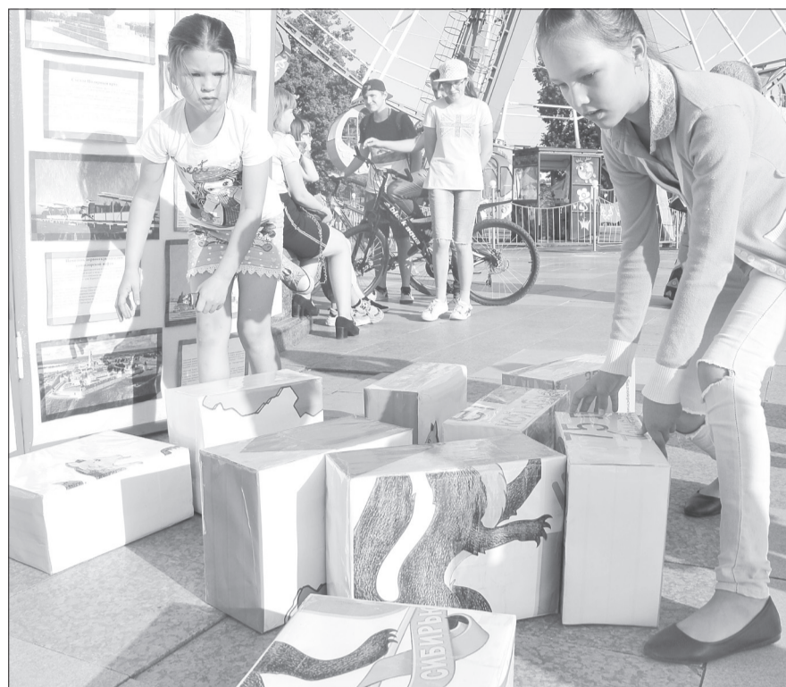
Много детворы собралось на площадке молодёжного центра. Из объёмных кубов они составили герб области, помогая друг другу и подсказывая

В горсаду читали «оды». На сцене городского сада выступали лучшие творческие коллективы. Здесь же прошла праздничная викторина о регионе, где за каждый правильный ответ ялуторовчане получали билеты на аттракционы. Кстати, только в этот день на них была