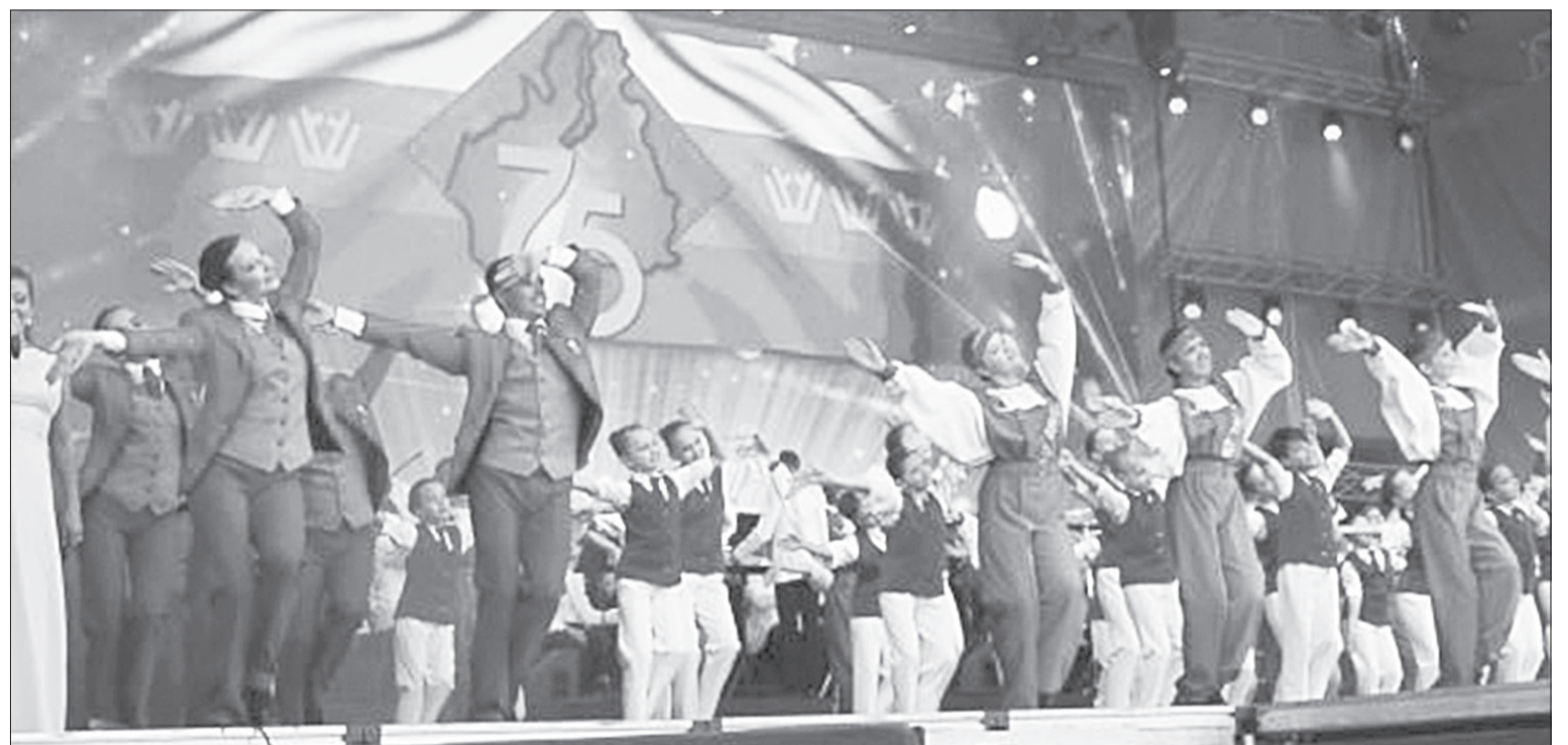
Современная Тюменская область, по словам губернатора, мощный центр притяжения, сюда приезжают жить и работать, не хотят уезжать те, кто здесь родился

Жители региона с необыкновенным размахом отметили 75-летие области