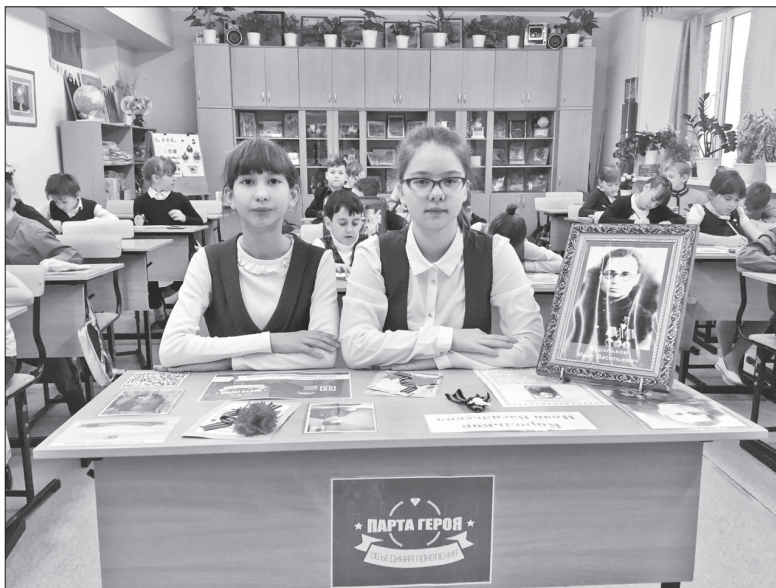
Парта Героя в Вагайской средней школе

подготовкой. В этот батальон попал и я, курсант, ефрейтор по званию. Меня назначили помощником командира взвода пулеметчиков. Вскоре наша часть попала на Центральный фронт. В боях с врагом я участвовал при взятии городов Орел, Глухов, Чернигов. Наш батальон входил в 221 стрелковый гвардейский полк 77 гвардейской дивизии 6 армии Рокоссовского. После освобождения Чернигова наша часть форсировала Днепр, где гитлеровцы создали сильно укрепленный узел сопротивления. За успешное выполнение заданий командования при форсировании Днепра мне и моим товарищам было присвоено звание Героя Советского Союза».