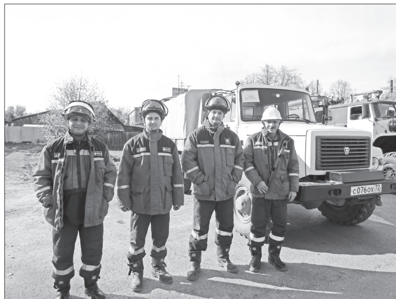
Представители Вагайского РЭС

В ходе первого этапа тренировки в администрации Вагайского района прошли заседания комиссии по чрезвычайным ситуациям и обеспечению пожарной безопасности, где рассмотрены вопросы по выработке решений по ликвидации чрезвычайных ситуаций, комиссии по повышению устойчивости функционирования объектов экономики, эвакуационных, эвакуационных комиссий. Были приведены в готовность системы