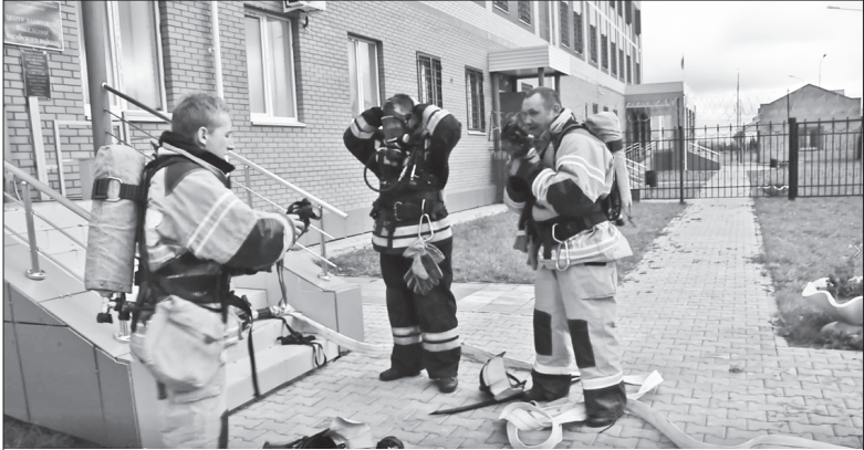
Сотрудники 153 ПСЧ на пожарно-тактических учениях

В целях предупреждения чрезвычайных ситуаций и обеспечения пожарной безопасности, повышения уровня профессионализма сотрудников МЧС в районе регулярно проводятся пожарно-тактические учения и учебно-тренировочные занятия.