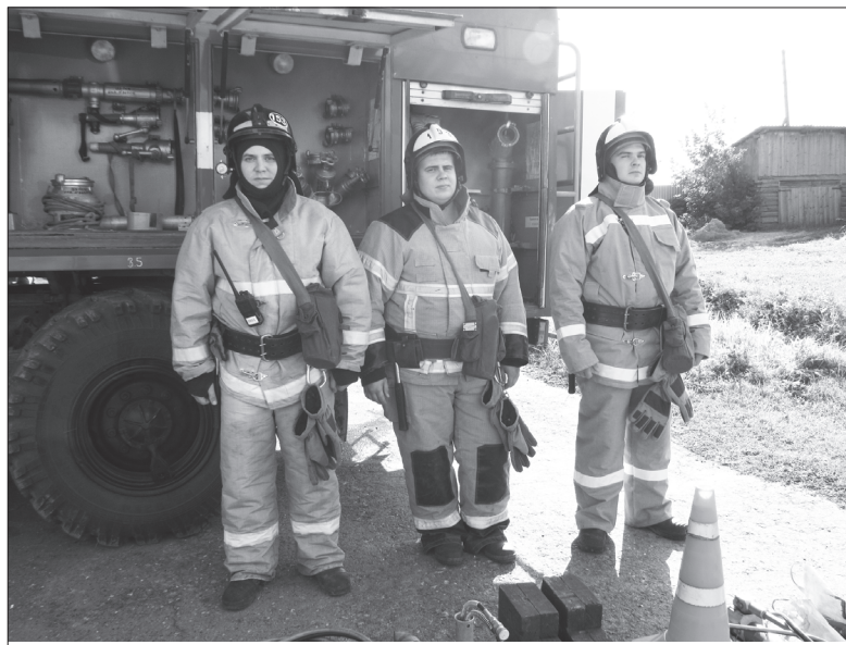
Пожарный расчет в полной готовности

К указанному времени на место проведения смотра друг за другом подъехали и выстроились