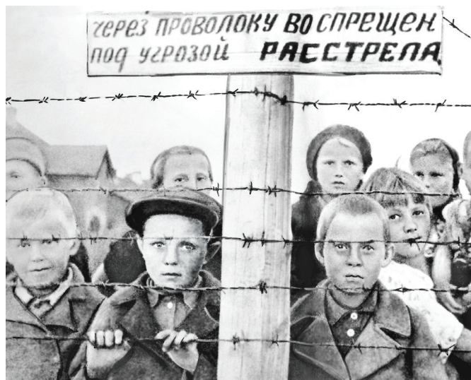
Советские дети – узники финского концлагеря № 6 в Петрозаводске – в день освобождения 29 июня 1944 года.