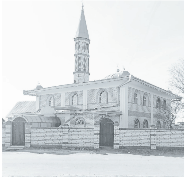
Проект мечети в д. Якуши (Тюменский р-н) был разработан архитекторами Саудовской Аравии. Строительство было завершено в 2000 г. за счёт средств из областного бюджета.

Марина МЕДВЕДЕВА.