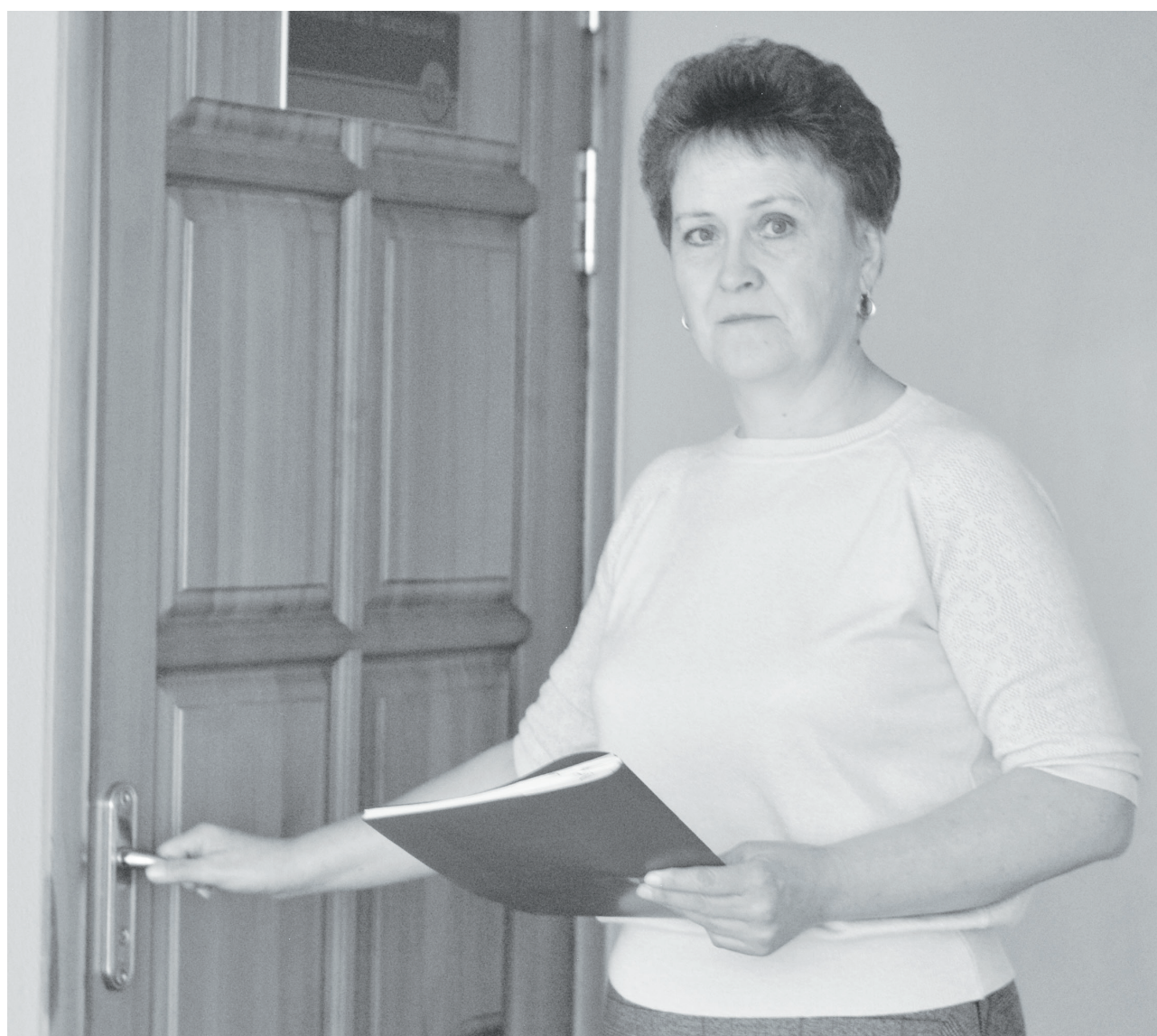
Татьяна Викторовна подготовила очередной пакет документов для совещания с коллегами.