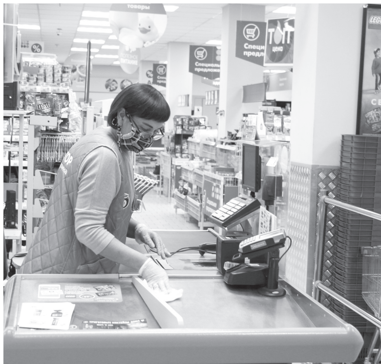
В ходе рейда на всех предприятиях отмечались соблюдение усиленного дезинфекционного режима, наличие в достаточном количестве дезинфекционных средств с вирулицидным эффектом, запас масок, кожных антисептиков, ежедневное проведение термометрии персоналу перед началом рабочей смены.

К магазину «Светофор» у проверяющих тоже не было нареканий.