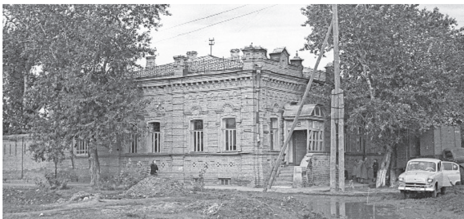
Здание аптеки № 19 в 1923–1985 годах. Конец 1950-х гг.

1 августа 1985 года началась работа ЦРА № 19 в новом помещении