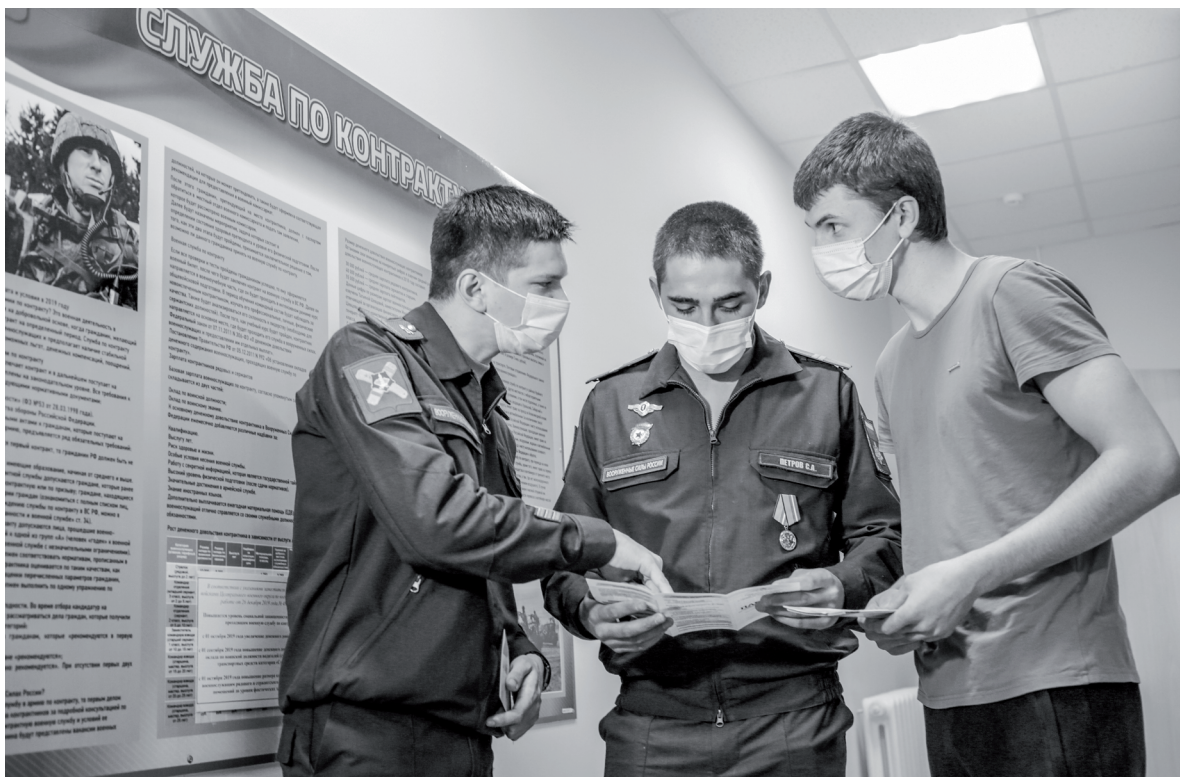
О преимуществах военной службы по контракту расскажут специалисты тюменского пункта отбора.

При переезде к месту службы выплачивается подъемное пособие (в среднем 21 тысяча рублей), при необходимости обеспечивается контейнер для перевозки личного имущества. Решается жилищный вопрос: либо предоставляется служебное помещение или общежитие на период службы,