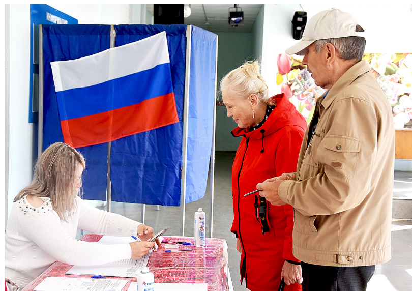
Голосуя на выборах, мы выбираем своё будущее. 2022 год

Подать заявление о голосовании по месту нахождения можно до 6 сентября 2023 года через портал «Госуслуги», в любом МФЦ и в любой территориальной избирательной комиссии, а в период с 30 августа