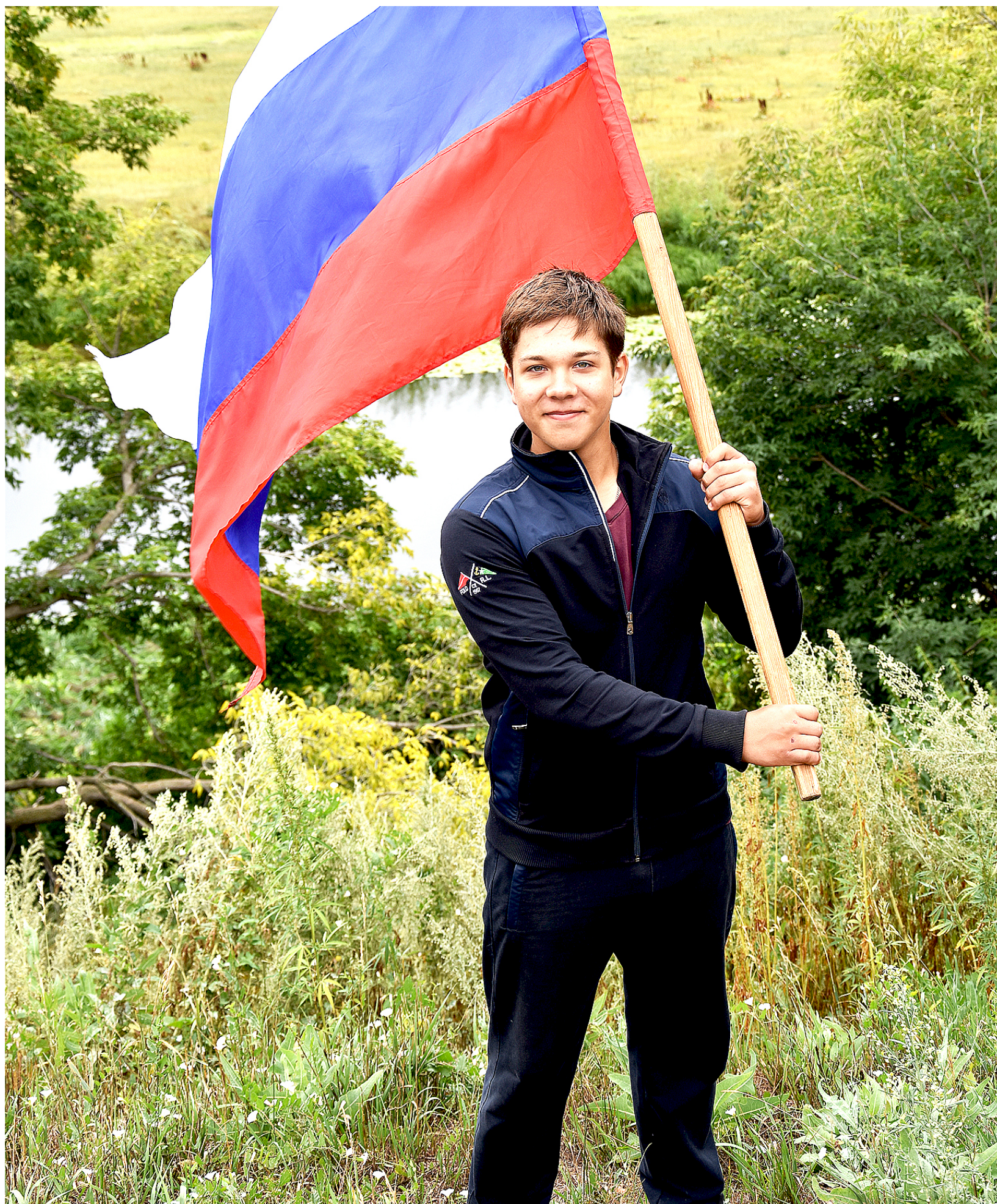
Российский флаг поднимает дух патриотизма у молодёжи

22 августа в России отметили День Государственного флага