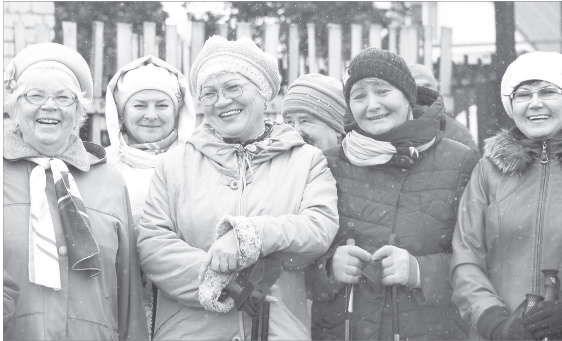
В Ялуторовске поклонников скандинавской ходьбы около четырёх десятков