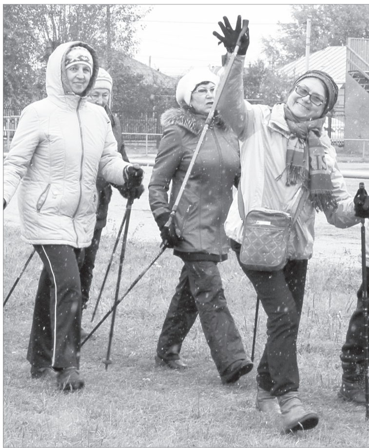
У «студентов» университета старшего поколения ходьба с палками - одно из любимых занятий

- Для укрепления здоровья ежедневно утром «наматываю» пять километров и вечером -