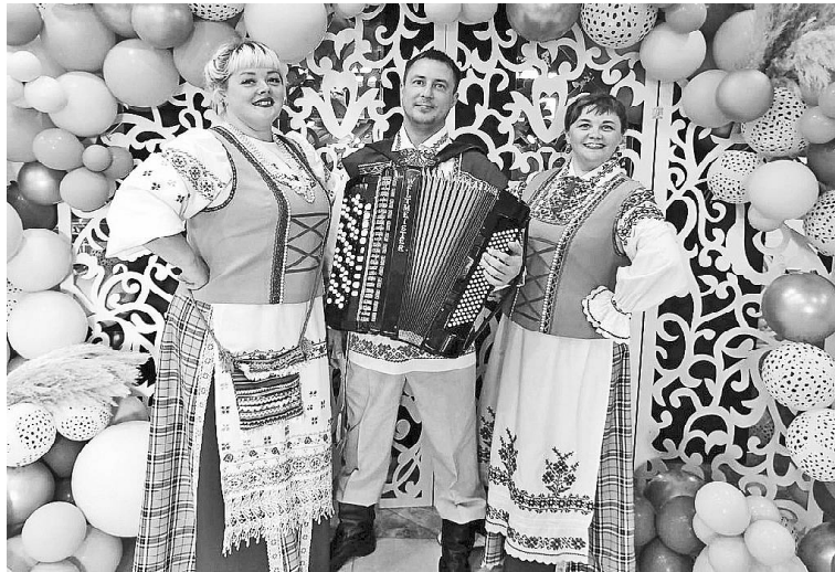
➤ Вокальный дуэт «Соцветие»

Впервые фестиваль «заководил» жителей Голышмановского района в 2015 году. Сегодня это мероприятие – самое ожидаемое событие в нашем округе, которое собирает гостей из самых разных уголков региона.