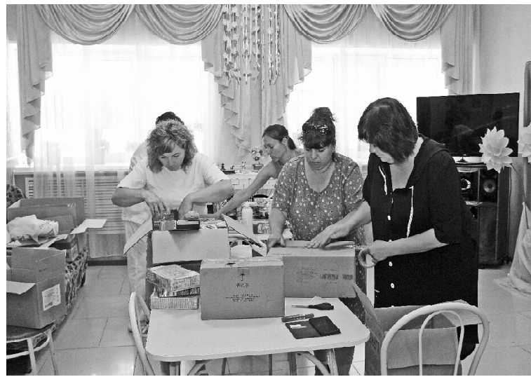
➤ Сбор посылок в Белгородскую область

такой акции стали члены Викуловского отделения «Союза женщин России». Все собранные вещи, одежда, сладости, консервы, предметы личной гигиены, продукты длительного хранения, детские подгузники были расфасованы по коробкам, упакованы и отправлены в пункт сбора города Тюмени.