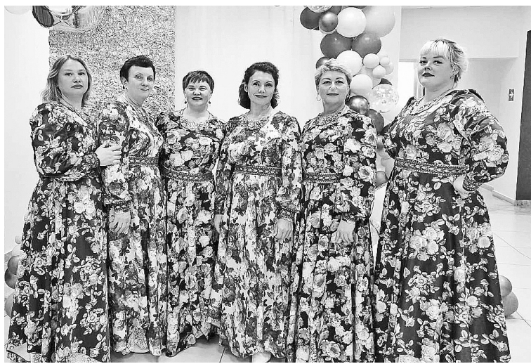
➤ ВА «Встреча с песней»

Всё больше творческих коллективов подлинного исполнения народной песни, танца стремятся выступить на сцене этого фестиваля. В этот день на главной сцене праздника собрались народные таланты, чтобы выразить свою любовь к Родине, воспеть культуру русского народа. Зрители горячо приветствовали бурными аплодисментами всех выступающих. Первыми показали своё мастерство танцевальные коллективы. Перехватили эстафету гармонисты