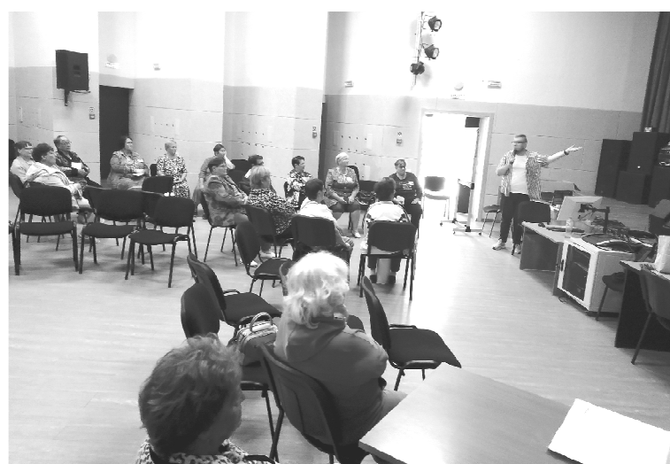
➤ Волонтеры за работой