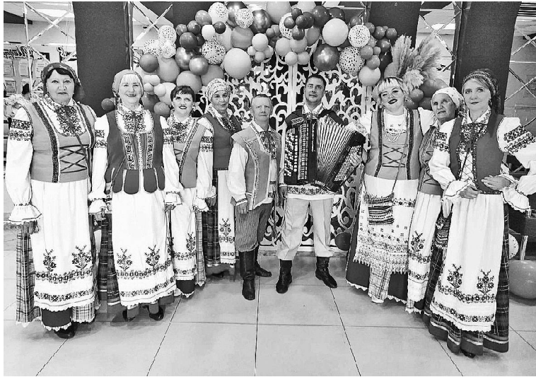
➤ НФЭА «Вячорки»

Привлекательность фестиваля – в переплетении былого и настоящего, в обращении к корням нашего народа. Шарохинский фестиваль изначально организовывался как реконструкция быта народов Сибири так, чтобы каждый нашёл в нём что-то своё, глубоко родное и неизжитое. Неслучайно символом фестиваля выбрали яркое солнце, объединяющее людей. Его участники погружаются в историю родного края, год от года предлагая к возрождению различные забытые обряды и игры.