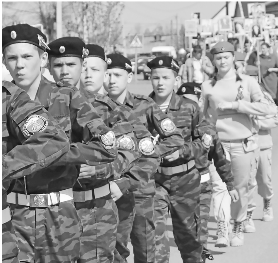
9 Мая. На параде в строю рядом кадеты и юнармейцы.