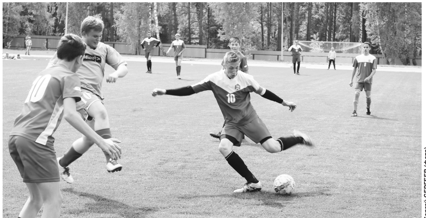
Атака исетской команды у ворот нашей сборной. Таких опасных моментов было немало.

После недолгой разминки команды вышли на поле и начались тактические баталии, прерываемые наставлениями тренеров команд. Обе сборных создавали друг для друга немало опасных моментов, но исетская команда в первой игре выглядела убедительнее, забив в ворота нижнетавдинцев четыре неприятных гола. Игра завершилась со счётом 4:1 в пользу гостей, хотя впереди ещё два матча, и у наших футболистов будет возможность проявить себя, если постараются.